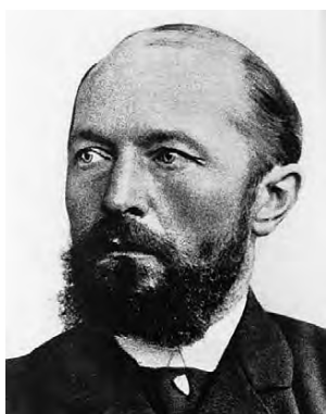
Obr. 7 E. von Behring