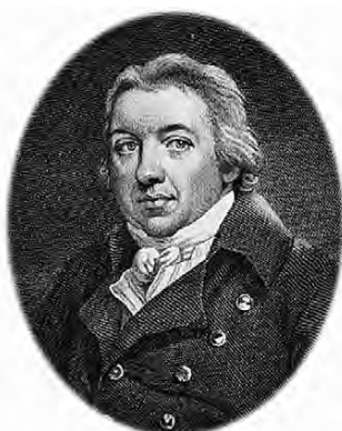
Obr. 4 E. Jenner