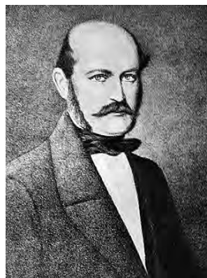
Obr. 3 I. F. Semmelweis