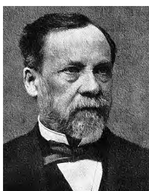
Obr. 5 L. Pasteur