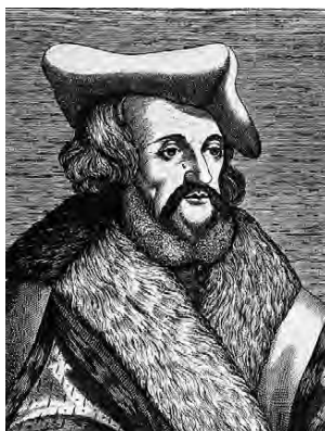
Obr. 1 G. Fracastoro