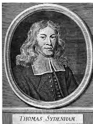
Obr. 2 T. Sydenham