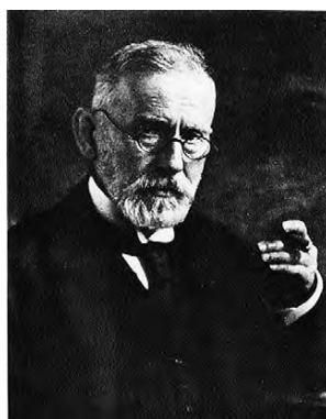
Obr. 8 P. Ehrlich