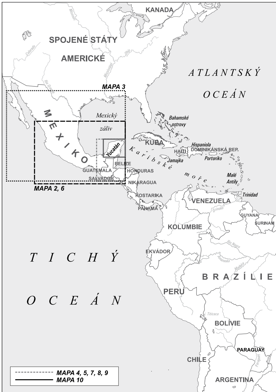
Obr. 1: Mezoamerika