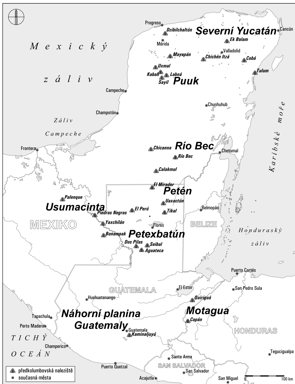
Obr. 5: Nejdůležitější subregiony mayské oblasti

toho tu najdeme města jako Tamarindito či Altar de Sacrificios a především Aguateca a Ceibal. Na protilehlé straně mayské oblasti na hranicích Chiapasu a Guatemaly v údolí řeky Usumacinta dominují města Palenque, Yaxchilán a Piedras Negras, opět poznamenaná dlouholetým nepřátelstvím. Charakteristickými znaky jsou zde obří akropole, štukové dekorace, propracované