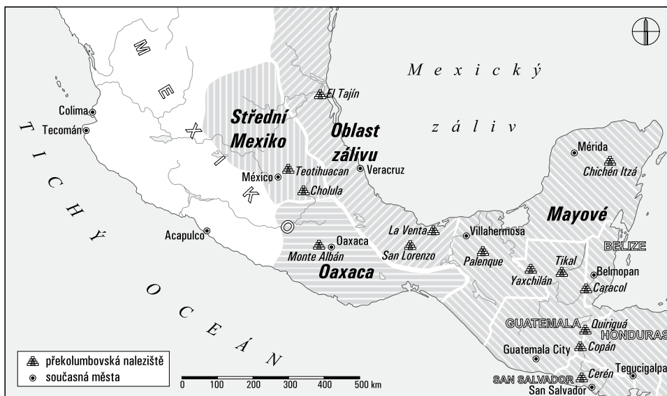
Obr. 2: Dílčí oblasti Mezoameriky

riku, mohou mít některé typické mezoamerické kulturní rysy (míčová hra na Antilách, charakteristická symbolika či rituály u Indiánů Louisiany apod.), naopak některé oblasti a kultury Mezoameriky mohou být pod vlivem cizích kultur (např. mayský Copán, charakteristicky ovlivněný Střední Amerikou). 4 A to platí nejen v oblasti duchovní kultury, ale především ryze materiálně – víme například s jistotou, že Mezoamerika čile obchodovala s kulturami jihu dnešních USA, kde se těžil tyrkys, v Mezoamerice jinak nepřítomný. Podobně v lokalitě Paquimé na samých hranicích dnešního Mexika a USA byly nalezeny doklady chovu pestrobarevných papoušků, kteří zjevně sloužili jako významný exportní artikl. 5 Jak ukazuje Winifred Creamerová, sféra symboliky a sféra ekonomiky se rozhodně nemusela překrývat – i přes doložený rozsáhlý obchod, který vedla Mezoamerika se svými sousedy (a který především čile provozovaly jednotlivé mezoamerické kultury mezi sebou), byla oblast všechno jiné, jen ne homogenní. Novější interpretační modely se ostatně také rozsáhle odklánějí od původního Kirchhoffova kulturního pojetí a pracují právě spíše s dílčími oblastmi Mezoameriky a s jejich vzájemnou interakcí, podobnostmi, rozdíly a ekonomickými vztahy. 6