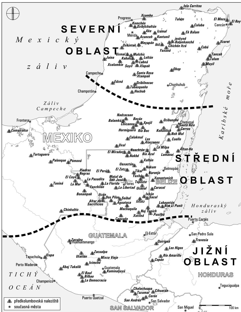
Obr. 4: Severní, střední a jižní část mayské oblasti

štukových ozdob; kamenné monumenty bývají bohatě řezané a nejkrásnější monumentální socha mayské oblasti pochází právě odsud. O něco severněji leží Petexbatún (někdy též Pasión podle řeky, která tu protéká), okolí stejnojmenného jezera, které krátce nabylo významu v pozdním klasickém období v souvislosti se založením Dos Pils, jež nakrátko ovládly celý region. Kromě