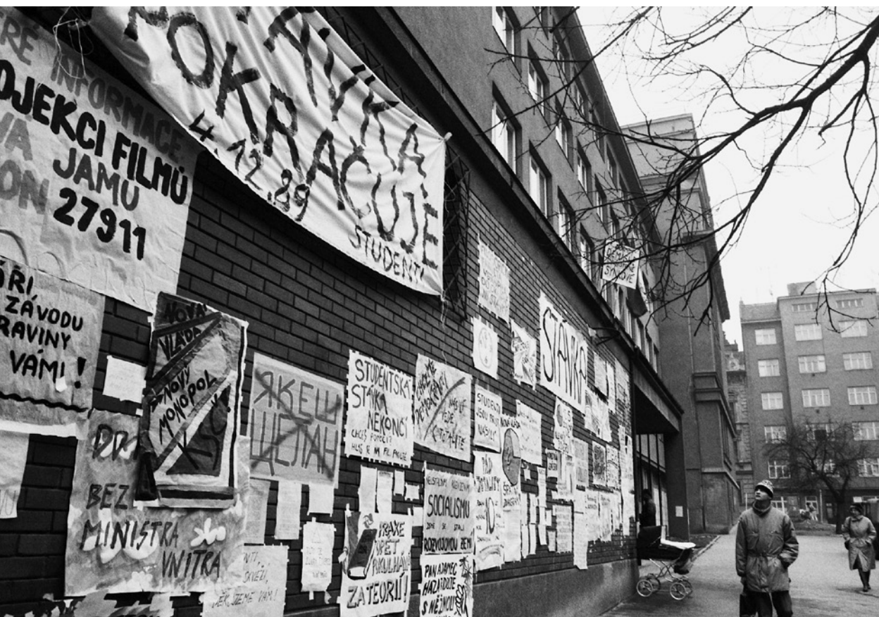
Budova filozofické fakulty Univerzity Jana Evangelisty Purkyně v Brně polepená plakáty (listopad 1989).

osobních deníků a na jejich základě začíná psát své komponované deníkové dílo, doplněné o retrospektivní a vzpomínkově laděné glosy a poznámky. 85