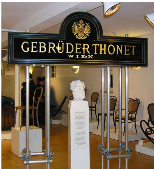
003 Vývěsní štít vídeňské prodejny na začátku 20. století, umístěný ve firmním muzeu Thonet Vienna ve Friedbergu