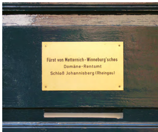
005 Zámek Johannisberg zůstává dodnes v majetku rodu Metternichů. Tabulka na dveřích správy Metternichova panství na zámku Johannisberg. Hospodářsky stojí zámecký velkostatek zejména na produkci vysoce kvalitních vín

V roce 1861 byla v Bystřici pod Hostýnem zahájena stavba druhé a největší továrny celého koncernu a ještě v téže roce byla uvedena do provozu. V tomtéž roce otevřeli prodejní pobočku v Pešti, první firemní prodejnu mimo Vídeň. Na přelomu století bylo těchto prodejen 24 po celém světě a ohýbaný nábytek se prodával i v těch nejexotičtějších zemích Asie a Jižní Ameriky. Započala expanze, která se v jiném průmyslovém odvětví jen těžko hledá. Roku 1865 kupují Thonetové na středním Slovensku panství Velké Uherce a za dva roky se tam rozbíhá třetí továrna. V roce 1867 kupuje Thonet pilu v Halenkově