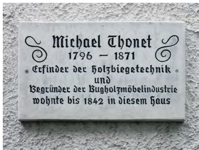
002 Pamětní deska na domě, v němž Michael Thonet v Boppardu bydlel až do svého odjezdu do Vídně roku 1842

Z těchto důvodů není pro tuto knihu možné použít slova „upravené a rozšířené vydání“; je to kniha zcela nová. S uzarděním je nutno dodat, že bylo co opravovat. Pokud se tedy něco v této knize od těch předcházejících liší, je samozřejmě správně to nyníjší.