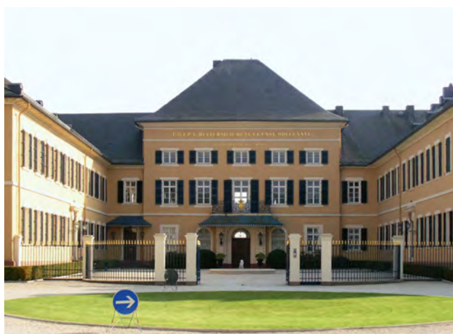
004 Vstup do zámku Johannisberg

lezu zevrubně vyložiti“. Chybí zde osobní kancléřova účast na výstavě.