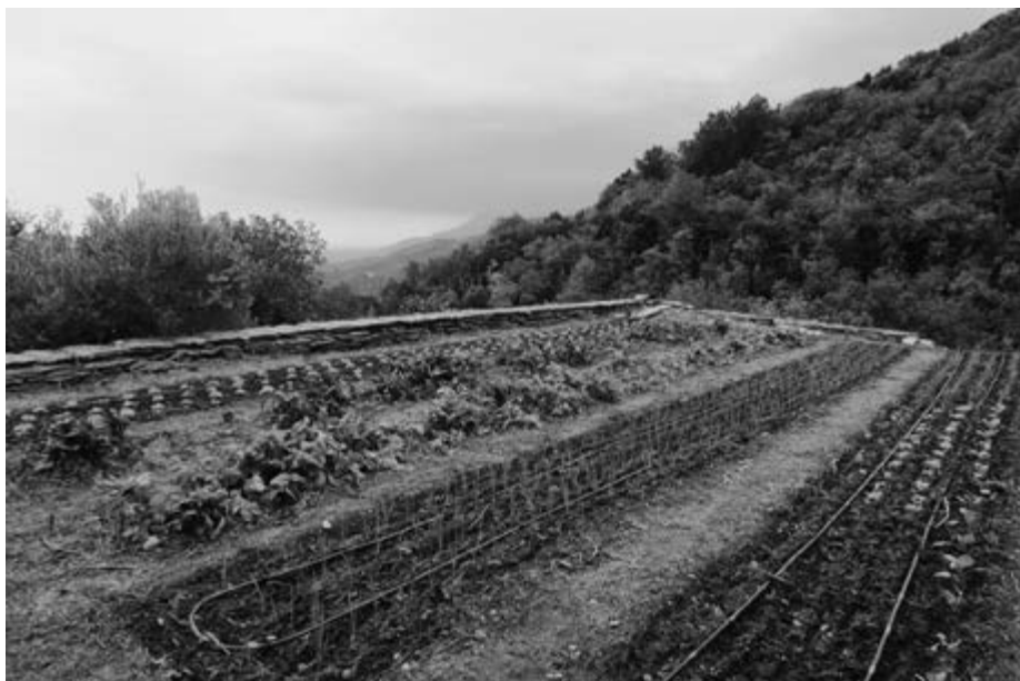
Současná klášterní zahrada se podobá té středověké, ale jeden rozdíl tady je – používá kapénkovou závlahu; Athos, oblast kláštera Pantokratoros.