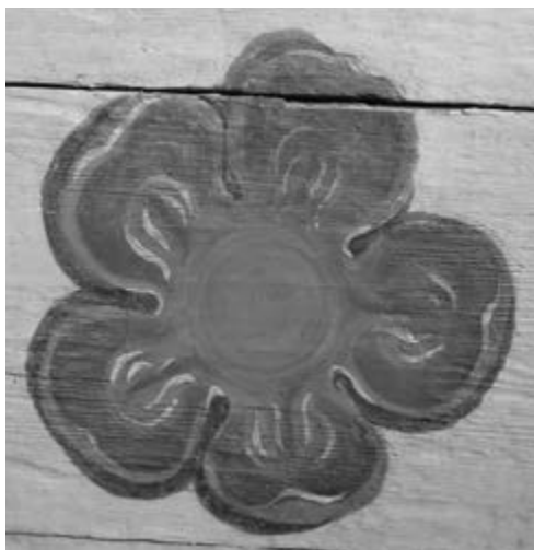
Obálka: Přírodní zahrada v Mutišově.