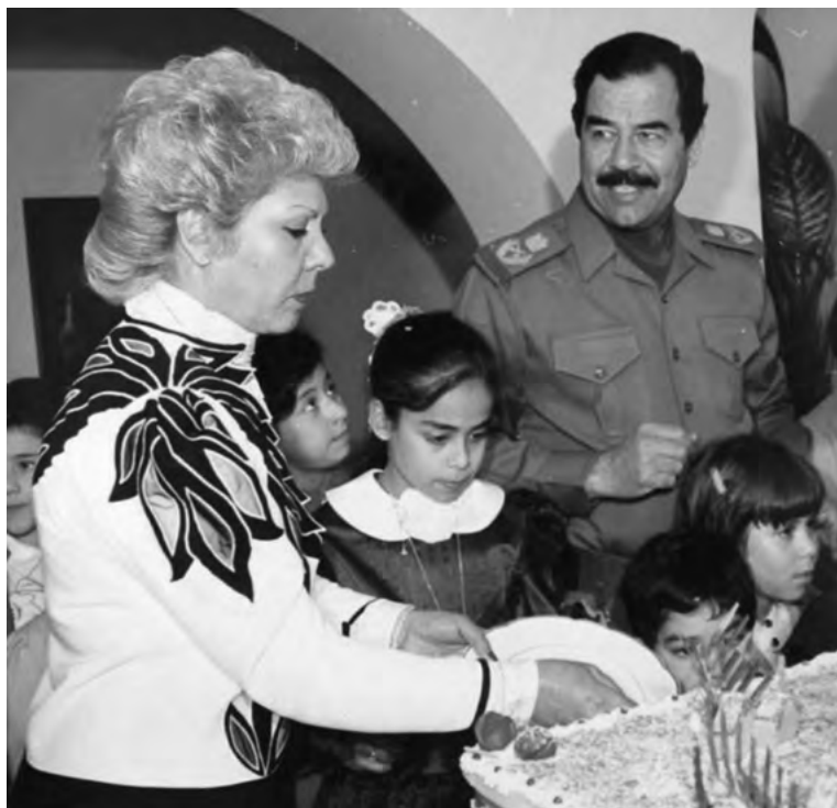
Saddám Husajn s první ženou Sádžidou a dcerou Halou