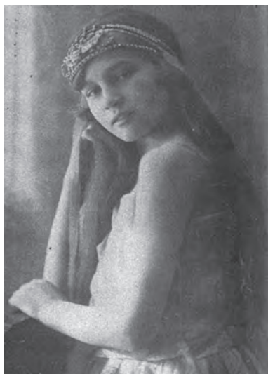
Královna lesních žinek

le pojal vůči Jirkovi zřejmou nechuť. To ovšem jenom zvýšilo matčinu bezmeznou lásku pro jejího prvorozeného, která se během let vyvinula v lásku opičí.