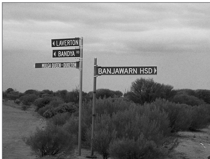
Nehostinná krajina v okolí Banjawarnu

K něčemu velmi podobnému totiž došlo i v noci z 28. na 29. května roku 1993 v blízkosti velmi odlehlého ovčívho ranče Banjawarn, 130 kilometrů východně od města Laverton v Západní Austrálii.