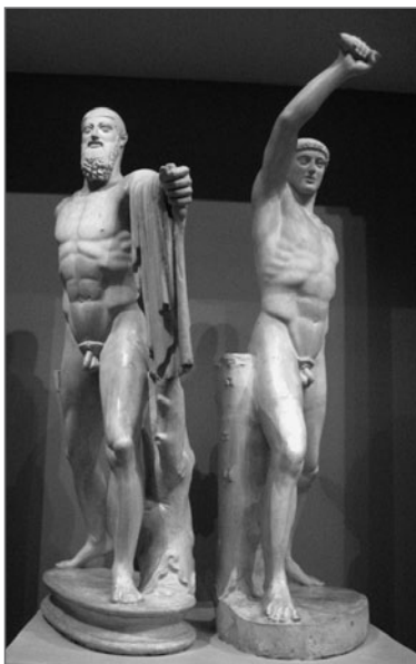
Sochy Harmodia a Aristogeitona, Puškinovo muzeum, Moskva

Thukydydes také tvrdí, že hlavní motiv atentátníků nebyl politický, ale osobní. Harmodios, tehdy „v plném květu mladistvé krásy“, a Aristogeiton, „občan ve středním věku“, byli milenci, ale Hipparchos se staršímu z nich mladíka pokusil přebrat. Atentát podnítily obavy, že zneužije své mocenské postavení Hippiova bratra, aby se Harmodia zmocnil silou. Staré rčení říká: „Nikdy nedovol, aby dobrý příběh pokazila fakta,“ a Thukydydes se jistě postaral, aby legendu o dvou tyranovraždách nepoškodily nevyhovující skutečnosti. Na důvěryhodnosti jí zpětně dodala skutečnost, že se Hip-