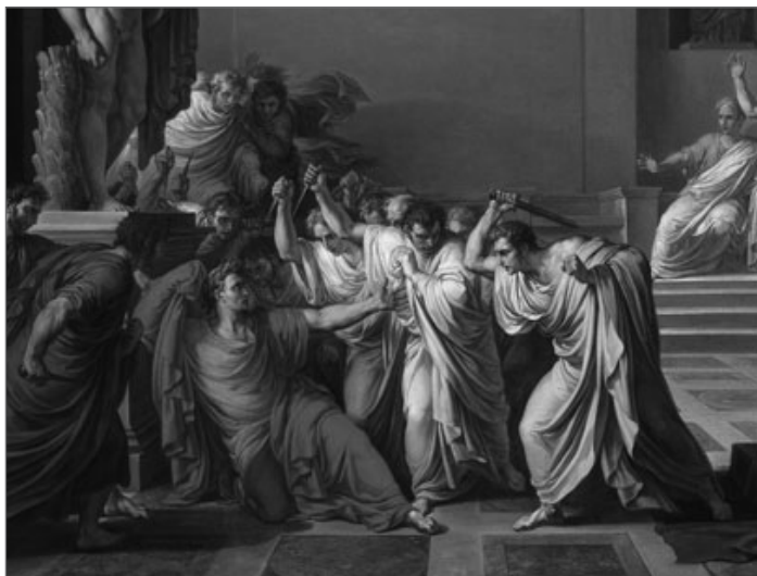
Vincenzo Camuccini, Zavraždění Julia Caesara, olej na plátně, 1804–5

Vstoupil Brutus, ten slavný – Marcus Junius Brutus. Byl to potomek jiného Bruta, který před mnoha staletími pomohl svrhnout tyrana Lucia Targuinia Superba. Byl také jedním z Caesarových nejbližších přátel a diktátor mu hodně pomohl v jeho kariéře. Jeho matka byla oblíbenou Caesarovou