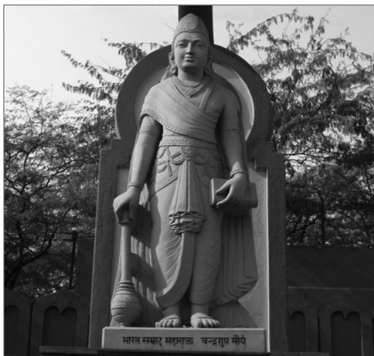
Socha indického vládce Čan- dragupty Marji, chrám Lakšmi Nárájan, Dillí, Indie.

V tomtéž století vytvořil indický učitel, filozof a královský rádce Čánakja (někdy známý jako Kautilja) novou a propracovanější teorii o atentátu. Navázal na Sun-c'ho a napsal: „Jediný atentátník může dosáhnout svého cíle zbraní, jedem a ohněm. Odvede práci za celou armádu, ne-li víc.“ Filozof předkládá celou škálu metod atentátníků, jako třeba využití krásných žen, které vyvolají mezi nepřátelskými vůdci spory a konflikty. Potom může udeřit atentátník a lidé budou předpokládat, že oběť zabil žárlivý sok. A co třeba poslat falešného lékaře, aby podal bláznivě zamilovanému nepřátelskému vůdci jed s tvrzením, že jde o nápoj lásky? A co když má král ve svých službách generála, o jehož věrnosti pochybuje? Čánakja navrhuje nasazení atentátníků do jeho armády, aby ho mohli zavraždit během bitvy a předstírat, že padl v boji. Filozof tvrdí, že atentát je vhodnější než zatčení a soud, protože eliminuje riziko, že přívrženci oběti vyvolají při jeho zatýkání nepokoje.