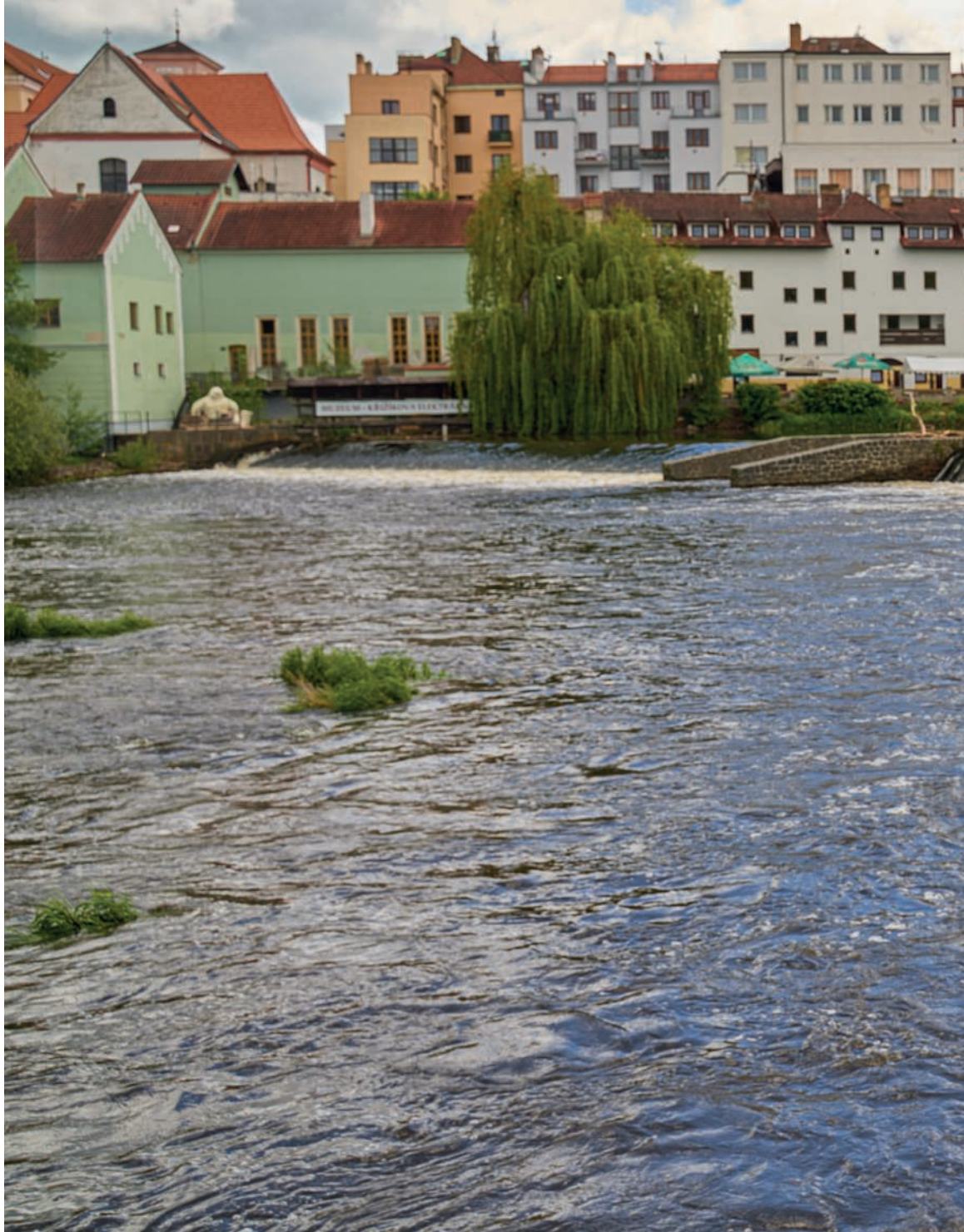
Jez na Otavě, v pozadí někdejší Podskalský mlýn, kde Písečtí postavili roku 1888 městskou elektrárnu