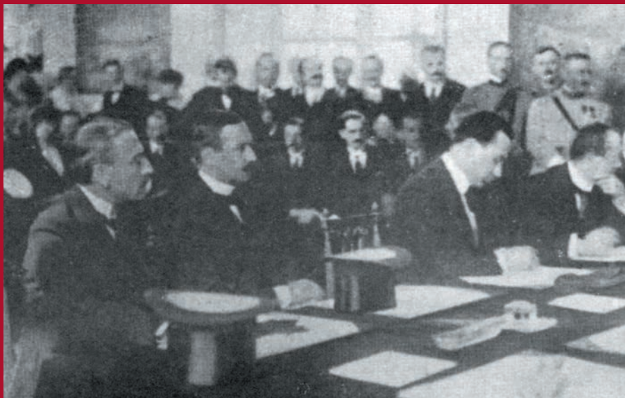
Štefan Osuský podpisuje mierovú zmluvu v mene Česko-Slovenska