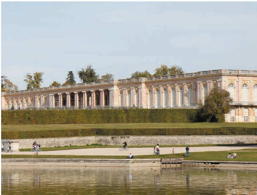
Palác Velký Trianon

aj dnes. Nejde len o to, že takmer v každom meste, ale aj v každej dedine vidíme pomníky padlých z tohto obdobia. Vojna sa na Západe skončila prímerím uzavretým 11. novembra 1918 vo francúzskom Compiègne, ale na Slovensku sa bojovalo ešte aj v prvom polroku 1919. Posledná vojnová operácia sa tu uskutočnila v polovici augusta 1919, keď česko-slovenskí legionári, dobrovoľníci a Sokoli obsadili Petržalku a odzbrojili tamojšiu maďarskú posádku.