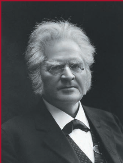
Bjørnstjerne Bjørnson: významný obhajca utláčaného slovenského národa v Uhorsku. Z pozície svetoznámeho intelektuála burcoval svedomie civilizovaného sveta na obranu malých národov.