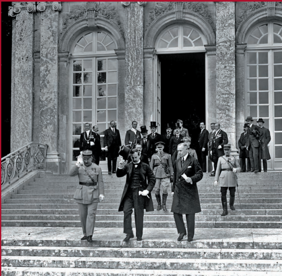
Odchod maďarskej delegácie z konferencie