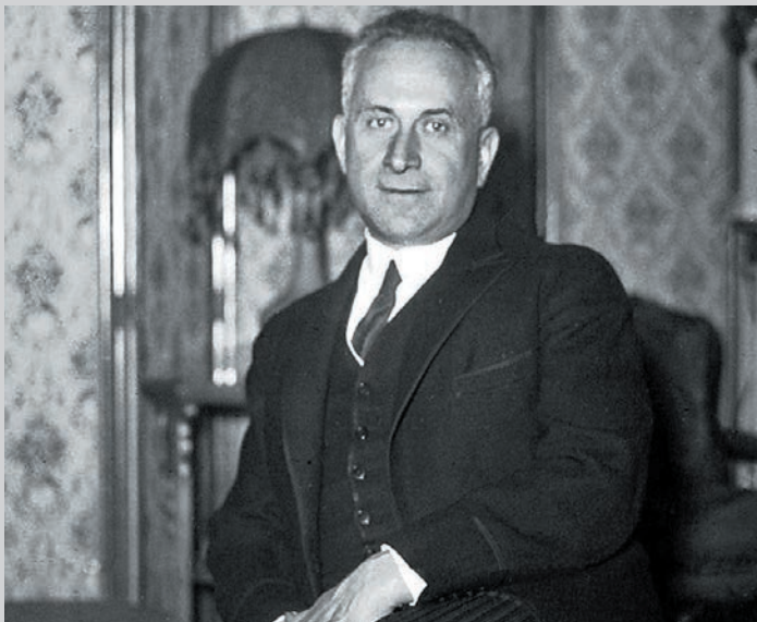
31. 3. 1889, Brezová (súčasná Brezová pod Bradlom) – 27. 9. 1973, Herndon, USA

Autori tejto publikácie venujú svoje spoločné dielo pamiatke slovenského diplomata Štefana Osuského, najmä jeho zásadnému podielu na príprave mierovej zmluvy v Trianone, ktorú tiež osobne podpísal v mene nového štátu.