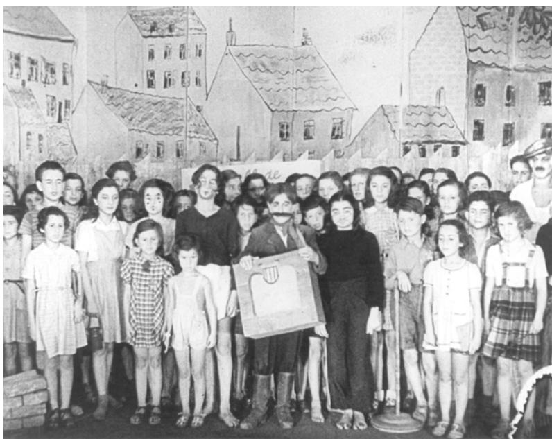
Finále dětské opery Brundibár . Fotografie z propagandistického filmu „Terezín. Dokumentární film z židovského sídelního území“ (1944), který je spíše známý pod názvem „Vůdce daroval Židům město“. Režíroval jej Kurt Gerron.

a dětech z Terezína rozhlasový pořad pro Sender Freies Berlin [Radio Svobodný Berlín].