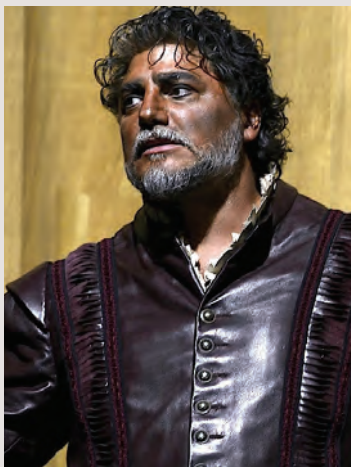
José Cura