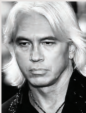
Dmitrij Chvorostovskij