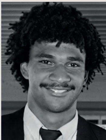
Rud Gullit