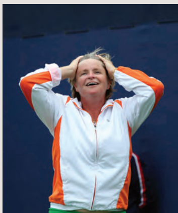
Hana Mandlíková

27. července 4. srpna 19. září 22. října 23. listopadu 26. listopadu 16. prosince