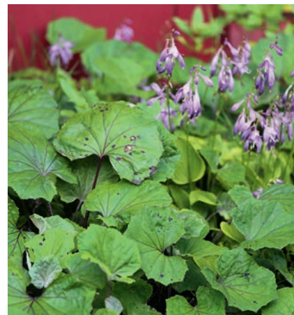
Podběl lékařský se vedle bohyšek na předzahrádce vydává za okrasnou trvalku.

Další, především jednoleté rostliny čekají pouze na to, až se při rytí dostanou na denní světlo. Jsou to oportunisté a osídlí každíčký kousek půdy. Nově založené květinové nebo zeleninové záhony – to je něco pro ně. Jejich semena bleskurychle vyklíčí a obsadí prostor dříve, než si jej stihne nárokovat vysévaná zelenina. Veškerou svou energii věnují rozmnožování, zatímco většina druhů zeleniny je dvouletá nebo víceletá a potřebuje nejprve dobrý kořenový systém – stačí si vzpomenout na mrkev, mangold, topinambur nebo cibuli. Merlík bílý je úplně stejný dobyvatel.