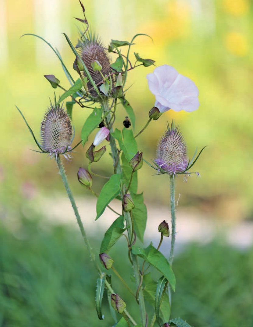
Opletník plotní se ovíví kolem štetky plané.