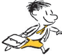
Mikuláš Je super!