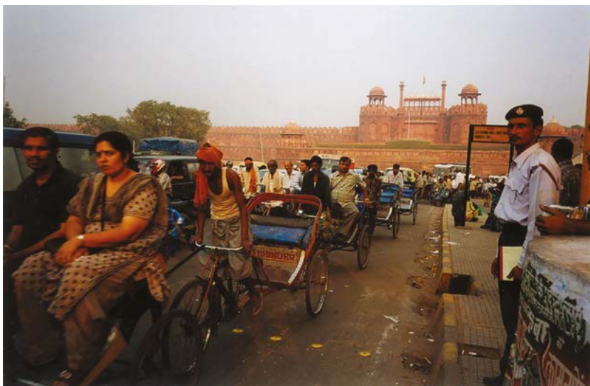
Red Fort (Červená pevnost) - Dillí