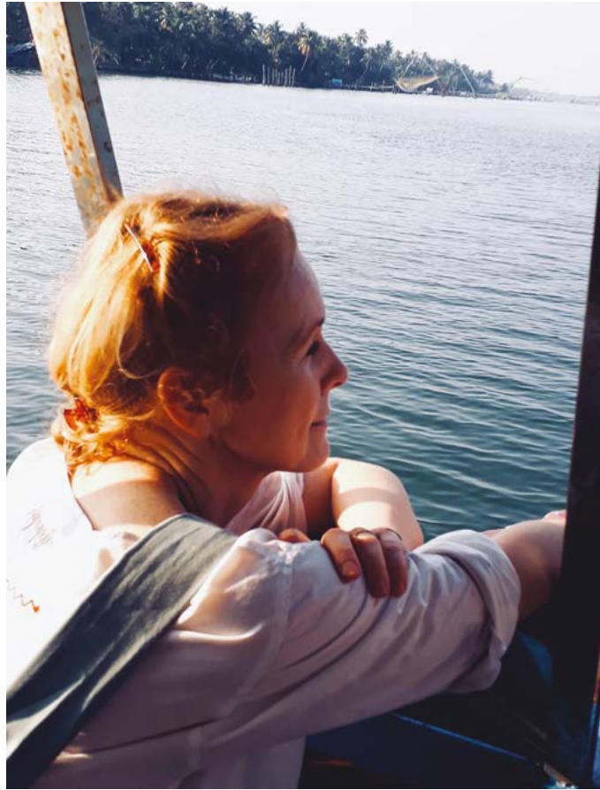
Backwaters - Kerala