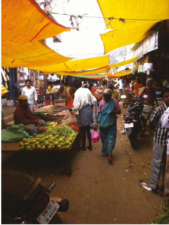
Jeden z mnoha trhů v ulicích každého indického města