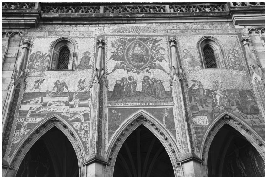
Mozaika Poslední soud nad Zlatou bránou svatovítské katedrály

Není proto překvapivé, že křesťané prokazovali od počátku dějin církve značnou úctu nástrojům Kristova utrpení, známým též pod názvem Arma Christi, což se překládá jako Zbraně Kristovy – ve smyslu „zbraně v boji za spásu člověka.“ Poněvadž se vztahují k Ježíšovým posledním dnům a hodinám jeho pozemského života, zejména k jeho utrpení, umučení a ukřižování, církevní tradice je často označuje jako nástroje Kristova mučení.