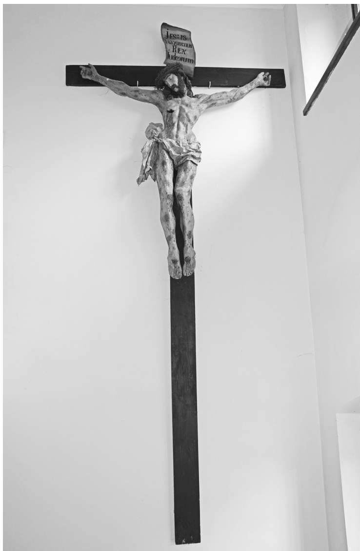
Kříž, který v procesí nosili členové Arcibratrstva Ježíš, Maria a Josef, jež působilo při pražské Loretě