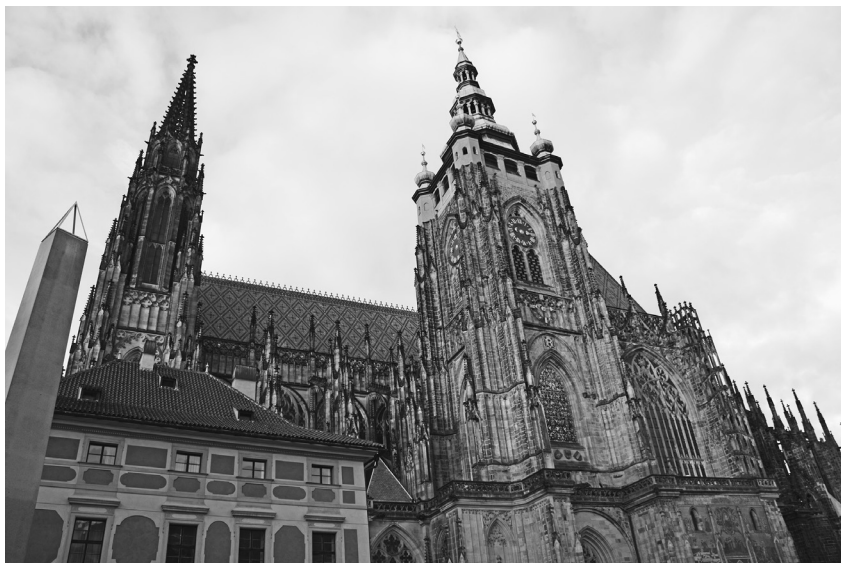
Katedrála sv. Víta

Ukřižovaného hlouběji prožívali význam kříže, jehož tíži sami nesli. Ústřední význam kříže i dalších nástrojů Kristova utrpení pro duchovní život plyne právě z této zkušenosti. Promítá se též do liturgie církevního roku i týdne, putování do Svaté země či poutí na místa uložení relikvií.