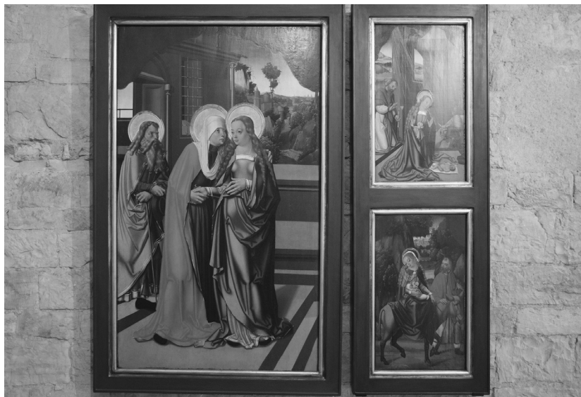
Mistr Litoměřického oltáře: Strahovský oltář (Navštívení Panny Marie, Narození Krista, Útěk do Egypta; kolem roku 1510, Strahovská obrazárna)

Pilátovi. Ten jej vinným neshledal a odmítl ho dát ukřižovat; pouze jej nechal zbičovat.