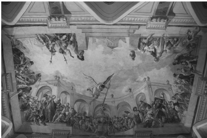
Siard Nosecký: Vstaň a chod' – uzdravení chorého u rybníka Bethesdy (klenba kapitulní síně Strahovského kláštera)

tak na přírodě (utištění bouře, prokletí fíkovníku, zázračný rybolov atd.). Byly znamením Ježíšovy božské moci a živé lásky, on je však neprováděl ani pro zábavu, ani pro potěšení přihlížejících.