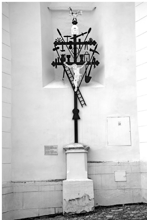
Kohoutí kříž (Arma Christi), přenesený z Nicova u Stach ke kostelu sv. Markéty v Kašperských Horách (1890)

v Paříži, a římský císař a český král Karel IV., který se proslavil mj. stavbou Karlštejna s kaplí Nástrojů umučení Páně. Na Karlovo přání zavedl papež Inocenc VI. v roce 1353 svátek Nástrojů umučení, které dal císař umístit do relikviářového kříže. Ten dodnes tvoří součást svatovítského pokladu.