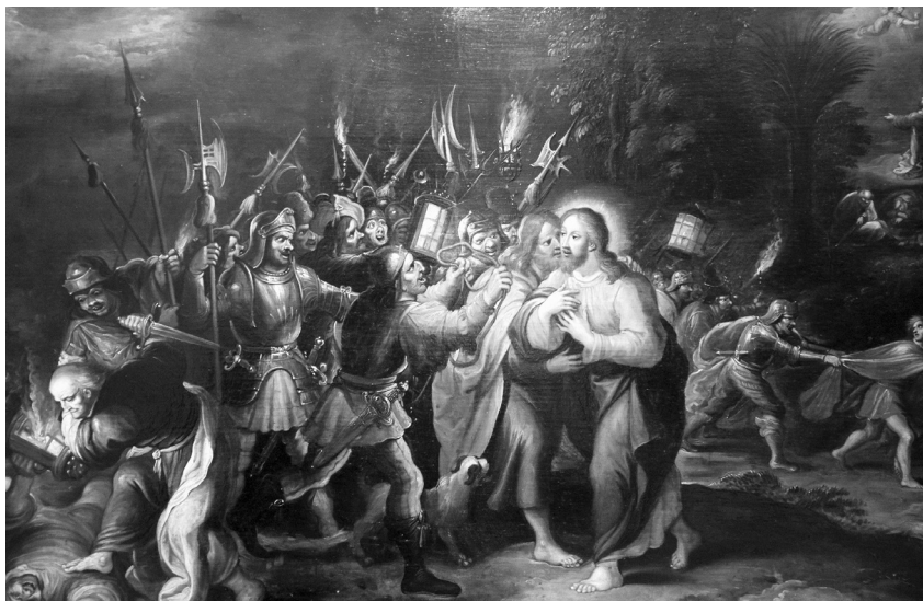
Cornelis de Baellieur: Zajetí Krista (před rokem 1650, Strahovská obrazárna)

te nade mnou, ale nad sebou a nad svými dětmi. 4 Byl těžkým břevnem natolik vyčerpán, že mu jej na základě nařízení jednoho z římských vojáků pomáhal část cesty nést jistý Šimon z Kyrény.