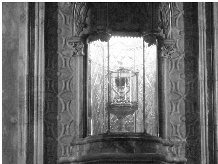
Za nejmáhodnější je považován svatý grál v katedrále Panny Marie ve Valencii