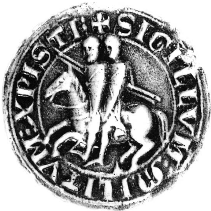
Templářská pečeť s typickým motivem dvou jezdců na jednom koni