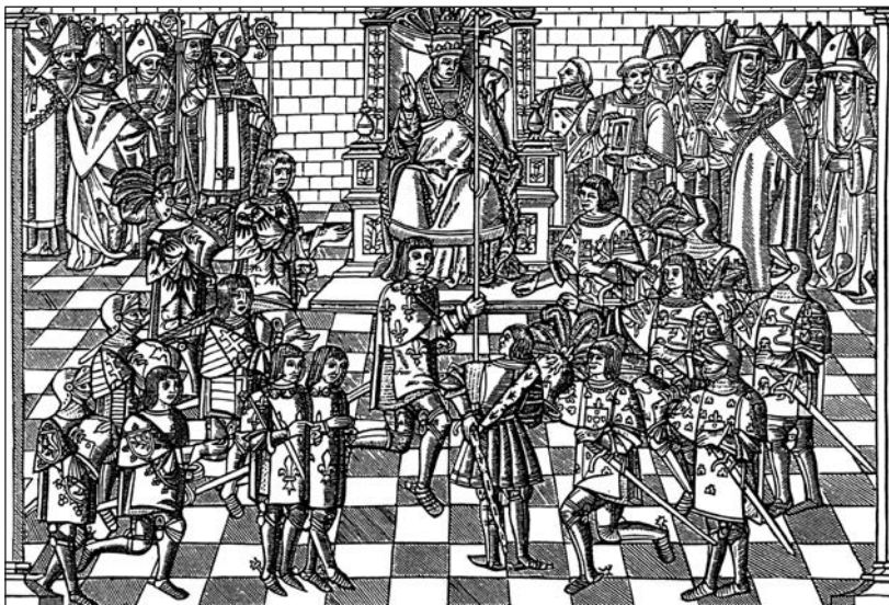
Papež Urban II. na koncilu ve francouzském Clermont, kde vyzval křesťany ke křížovému tažení.

Ať už byly politické a mocenské úvahy papeže Urbana II. jakékoliv, dokázal tím, že zahájil tak rozsáhlou akci, veškerou církevní organizaci aktivizovat takovým způsobem, že najednou po staletích zmatků, sporů, rozdrobenosti národností, zájmové, přesunu celých národů a zároveň dodržování základních rysů lénní soustavy, feudalismu, stojí tu centrální a centralizovaná organizace církevní, schopná rozsáhlé akce. Na prvních křížových výpravách si církev ověřovala schopnost spojit chudáka i pána v jednom masovém hnutí, to jest obelstít chudáka ve prospěch pána, a skutečně se jí to dařilo. Překvapující bylo, ovšem jen na první pohled, že nadšení, ale i chtivost táhnout na Střední východ, zachvátila doslova lid obecný. Víra náboženská prožívala své červánky, byla ještě hluboká a naivní, i strašná a krutá v přímočarosti odsouzení těch z mála, kteří se jí vymykali. Bylo to 11. století náboženského nadšení, tak jiné ve srovnání s 13. stoletím