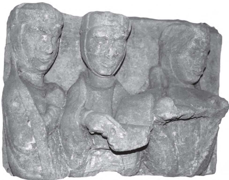
[4] Cisterciačky přišly do Marienthalu pravděpodobně ze slezské Třebnice. Reliéfni zobrazení jeptišek třebnického konventu. Třebnice, lapidárium kláštera.

Odkud jeptišky do Marienthalu přišly, není z pramenů známo. V úvahu přichází několik ústavů cisterciaček, s nimiž mohl být pražský královský dvůr v kontaktu. Na prvním místě lze uvažovat o slezské Třebnici, založené v roce 1202 vratislavskou kněžnou Hedvikou, manželkou knížete Jindřicha I. Klášter v Třebnici byl pražskému královskému dvoru dobře znám, neboť zde byla před rokem 1213 vychovávána Anežka, dcera Přemysla Otakara I., a v době, kdy se chystalo založení kláštera Marienthal, žila ve Slezsku další ze sester Václava I. Anna, manželka budoucího vratislavského knížete Jindřicha II. a snacha zakladatelky. 45 Pověst třebnického kláštera spolu s ohlasem zbožnos-