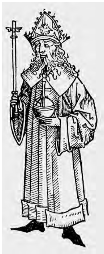
Karel IV. na vyobrazení v Schedelově kronice