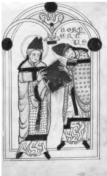
Sv. Augustin předává Norbertovi řádová pravidla (miniatura z prvního Norbertova životopisu, kolem r. 1140)

a Hradčany jsme poznali kapucíny). V západní církvi dnes rozeznáváme sedm hlavních forem řádového života – a řeholní kanovníci jsou jednou z nich. Kromě premonstrátů k nim patří augustiniáni.