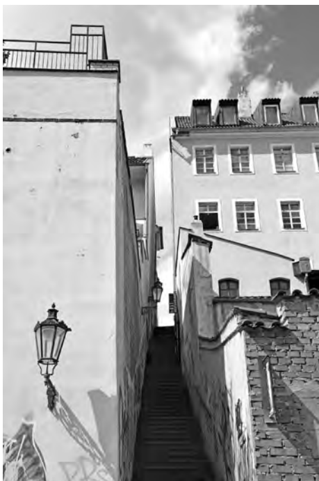
Průchod mezi domy Loretánská 179/15 a 103/17

dochovaná požární ulička propojující ulici U Lužického semináře a zahrádku restaurace Čertovka.