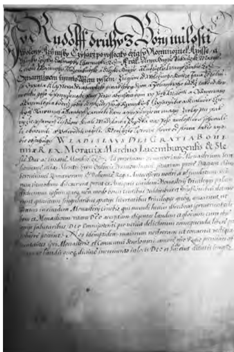
Rudolf II.; potvrzení výsad a privilegií Strahovského kláštera tímto panovníkem (1591)