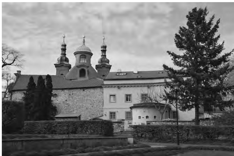
Strážní domek Strahovská 204/15, za ním kostel sv. Vavřince

Podle jedné teorie se označení Strahov používalo původně jen pro klášter, strážící od západu Pražský hrad. To se mi nezdá; naopak se domnívám, že právě již v 11. století nesla toto jméno lokalita – a název později přešel na klášter. Mou domněnku potvrzuje i Kronika tak řečeného Dalimila (pravda, psaná až počátkem 14. století), která zmiňuje „les Strahov“ v souvislosti s vyhnáním Poláků z Hradu v roce 1004.