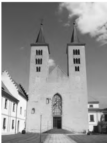
Milevský klášter s bazilikou Navštívení Panny Marie

ně, nebo pod tlakem příslušného biskupa – a že vznikaly také nové kanovnícké komunity.