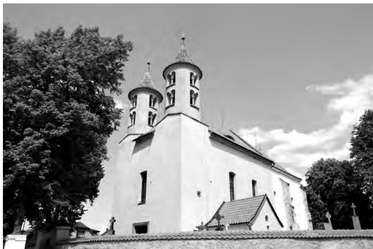
Kostel sv. Bartoloměje v Kondraci

sakristii), do určité (a poměrně značné) výše obě věže... a nakonec by sem patřila i tzv. kaple zakladatelů, kam byly přeneseny Vladislavovy ostatky, jenže ta se „ztratila“.