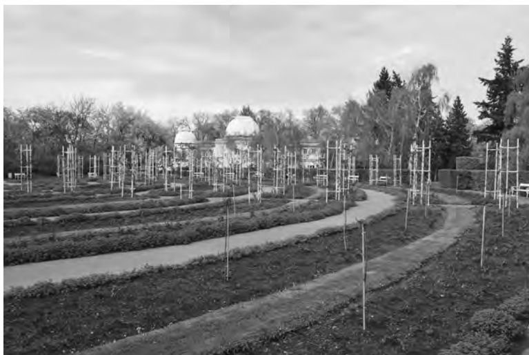
Růžový sad na Petříně

jistota každopádně neumenšuje půvab zelené hory či přesněji řečeno náhorní planiny, vypínající se do výše 327 metrů nad mořem.