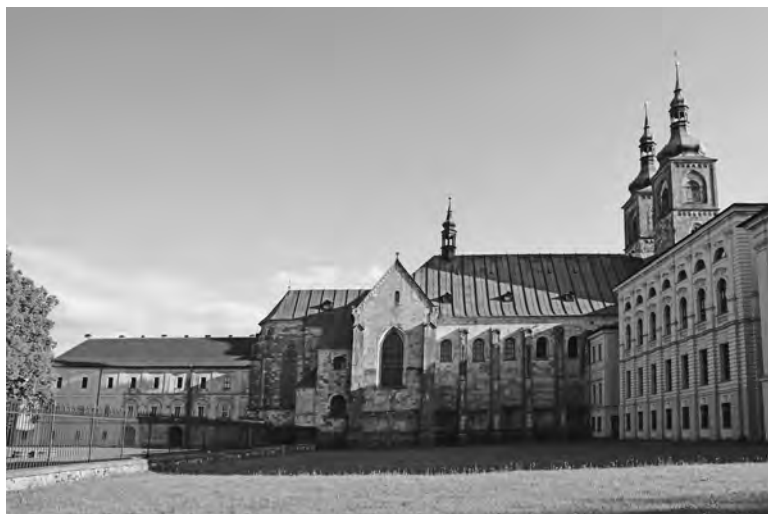
Klášter Teplá s kostelem Zvěstování Páně

ku éry tohoto parazita, v letech 1577 a 1578, držel Strahov pouhé čtyři vesnice z původních 90 (!) a ožíval pouze tehdy, když do něj z města přicházel mladý bratr původem z Teplé a sloužil v kapli svaté Voršily mši. Poté, co na trůn usedl Rudolf II., vrátili se na Strahov tři řeholníci a onen obětavý mladík z Teplé se stal jejich převorem. Brzy se s ním znovu setkáme.