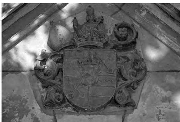
Fara a kostel sv. Cyrila a Metoděje v Praze-Nebošicích; sv. Norberta a jeho následovníky nacházíme i zde

Norbertem. Třetí řády nacházíme i u jiných řeholí, ovšem premonstrátský má výjimečné postavení: je považován z nejstarší v celé církvi.