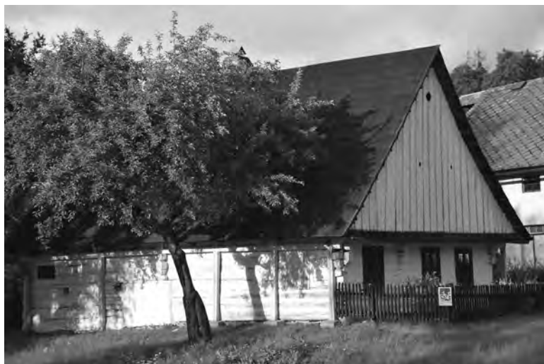
„Domek Prokopa Diviše“ v Helvíkovicích

v neúplné podobě) součástí tzv. Kodexu milevského , uchovávaného ve Strahovské knihovně.