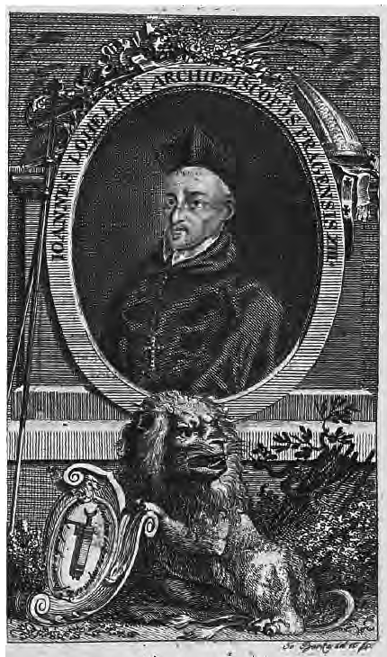
Jan III. Lohelius jako arcibiskup pražský