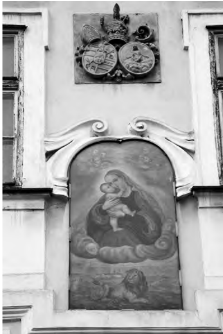
Výzdoba fasády domu U Zlatého lva nás nenechává na pochybách, v jakém sakrálním okrsku se nacházíme

li vděčí... Požáry ho samozřejmě devastovaly, a to odedávna. První zmínku o takovém neštěstí máme již ke konci 11. století, poté o něm čteme k roku 1420, 1541, 1742... A zřejmě jich bylo víc, neboť název Pohořelec je poprvé zaznamenán ve 14. století, čemuž podle mého názoru předcházela katastrofa nedávnějšího data než ta, která se odehrála o dvě až tři staletí předtím.