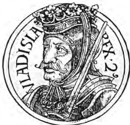
Král Vladislav II.

společné iniciativě premonstrátů, cisterciáků a johanitů. Svědčí o tom barokní epitaf z roku 1727, opěvující Vladislava coby „mocného lva Českého království, slavné slunce českého nebe“. Epitaf král sdílí s Jindřichem Zdíkem a 11. pražským biskupem Janem I., stojícími u vzniku Strahovského kláštera (Jan mu věnoval rozsáhlé državy ve východních Čechách, avšak založení se nedožil). Samotnou kryptu ani tzv. kapli zakladatelů se bohužel dodnes nepodařilo najít; strahovský premonstrát Vilém Ondráček ve své jubilejní knize Strahov (1927) vyslovil hypotézu, že se krypta nacházela snad v místech později zřízené opatské hrobky, která je v bazilice dodnes (od josefinských reforem se do ní nepohřbívá).