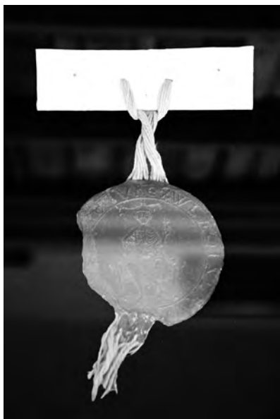
Pečeť Vladislava II.