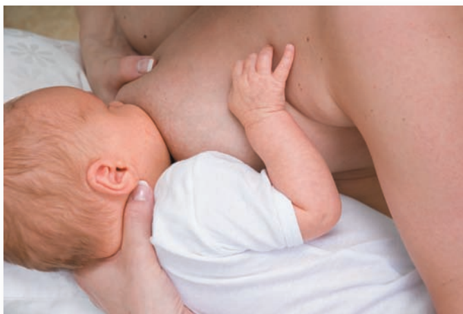
Bočtní, fotbalové držení.