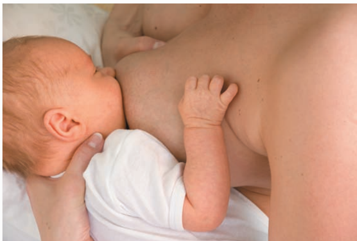
Správná vzájemná poloha matky a dítěte.