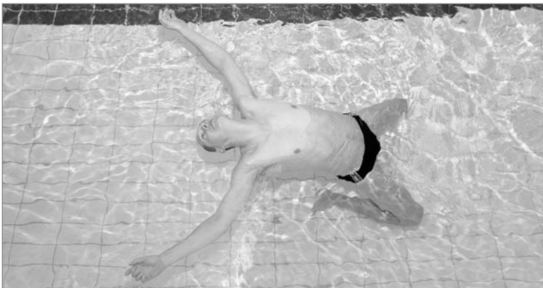
Obr. 4 Vznášení na zádech