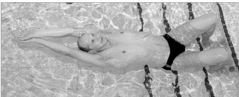
Obr. 5 Splývání na zádech po odrazu od kraje bazénu

Jedním z možných komplexních cvičení, které prověří vaši plaveckou úroveň, je např. skok do vody ze skokanského zařízení – z prkna ve výšce 1 nebo 3 m, nemusí to být ani skok střemhlavý.