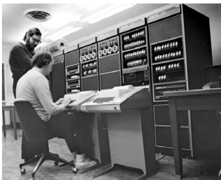
Obrázek 1.3: Arpanet začínal v době sálových počítačů