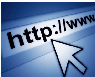
Obrázek 1.5: Zápis www adresy do prohlížeče internetu

Domény jsou vlastně IP adresy převedené na text. Jméno počítače se skládá z domén oddělených tečkou, např. http://mail.volny.cz . Doména nejvyšší úrovně je vpravo (cz), doména druhé úrovně je vlevo od ní (volny), určuje název organizace, 3. úroveň určuje název počítače v rámci organizace apod. Doména první úrovně určuje skupinu podle země nebo kategorie (cz – Česká republika, us – USA, com – komerční organizace, edu – vzdělávací instituce, gov – vládní stránky, mil – vojenské stránky atd.).