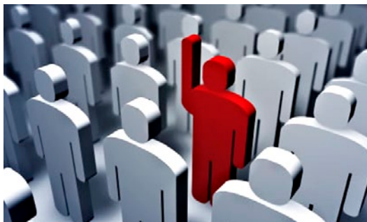
Obrázek 1.6: IP adresa identifikuje každý jednotlivý počítač v internetu

Každý počítač připojený k internetu má svoji IP adresu. Donedávna platilo, že IP adresa je 32bitové číslo a že se uvádí jako čtyři desítková čísla v rozmezí 0–255 oddělená tečkou – např. 192.168.1.1. Tato informace je stále pravdivá, ale jelikož postupem času došlo k vyčerpání adresního rozsahu, který tvořil počet 2^{32} = 4\,294\,967\,296 , bylo nutno zavést další verzi IP protokolu. Prvotní a stále využívaná verze má označení IPv4, novější pak IPv6. Tato verze má kromě jiného adresy 128bitové, které poskytují větší adresní prostor než 32bitové adresy v IPv4. V praxi je užití modernizované verze IP protokolu méně praktické, protože adresy obsahují také šestnáctkové hodnoty – typická IP adresa je tak v IPv6 například takováto – 2001:0db8:0:0:0:1428:57ab.