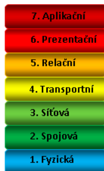
Obrázek 1.4: Sedm vrstev modelu ISO/OSI

Protokolová struktura TCP/IP je definována jako sada protokolů pro komunikaci v počítačové síti, jež se využívá zejména na internetu, ale také v běžných počítačových sítích. Jde vlastně o komunikační protokol, což je množina pravidel, které určují podobu a význam jednotlivých zpráv při komunikaci. Vzhledem ke složitosti problémů je síťová komunikace rozdělena do tzv. vrstev, které znázorňují hierarchii činností. Výměna informací mezi vrstvami je přesně definována. Každá vrstva využívá služeb vrstvy nižší a poskytuje své služby vrstvě vyšší. Celkový význam zkratky TCP/IP je Transmission Control Protocol/Internet Protocol. Komunikace mezi stejnými vrstvami dvou různých systémů je řízena komunikačním protokolem za použití spojení vytvořeného sousední nižší vrstvou. Architektura umožňuje možnost výměny protokolů jedné vrstvy bez dopadu na ostatní. Architektura TCP/IP je členěna do čtyř vrstev (na rozdíl od referenčního modelu ISO/OSI se sedmi vrstvami): aplikační vrstva (application layer), transportní vrstva (transport layer), síťová vrstva (network layer) a vrstva síťového rozhraní (network interface).