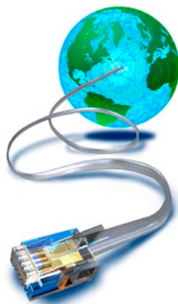
Obrázek 1.1: Díky internetu jste spojení s celým světem

Internet je velmi rozsáhlá počítačová síť, jejíž hierarchie se řídí určitými pravidly. V minulosti byl výsadou akademických a vědeckých pracovníků, běžní uživatelé se k jeho obsahu dostali jen výjimečně. Dnes jej používají děti, studenti, rodiny, důchodci, prostě všichni, kteří chtějí informovat a být informováni. Nemale procento uživatelů internetu tvoří lidé, kteří chtějí komunikovat, přičemž internet jim poskytuje levnou a pohodlnou cestu ke spojení s celým světem.