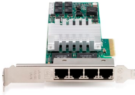
Obrázek 1.7: Serverová síťová karta s jedinečnou MAC adresou

celosvětově jedinečná. Z hlediska přidělování je rozdělena na dvě poloviny. O první polovinu musí výrobce požádat centrálního správce adresního prostoru a je u všech karet daného výrobce stejná (či alespoň velké skupiny karet, velcí výrobci mají k dispozici několik hodnot pro první polovinu). Výrobce pak každé vyrobené kartě či zařízení přiřazuje jedinečnou hodnotu druhé poloviny adresy. MAC adresa může mít třeba takovýto tvar: 00-11-09-95-26-FE.