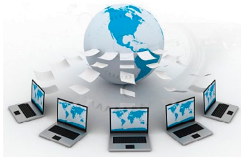
Obrázek 1.2: Na internet se připojují lidé z různých končin Země

řídícího centra. Skládala se z řady vzájemně propojených uzlů rovnocenné důležitosti. Posílaná data se na dobu přenosu rozdělí na několik samostatných částí nazývaných pakety. Každý z paketů je vybaven údajem o adresátovi, a tvoří tak de facto autonomní zásilku, která cestuje k cíli samostatně, svou vlastní cestou, nezávisle na ostatních paketech. V případě zničení jedné z přenosových cest může paket bez problémů dojít k adresátovi alternativní cestou – přes zbývající zachovalé uzly. A to je vlastně základ koncepce internetu, jak ji známe dodnes.