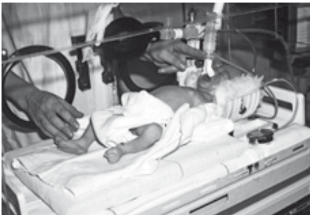
Obr. 1.3 Nazální CPAP v sedmdesátých letech 20. století (z archivu autorky)