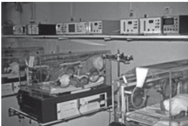
Obr. 1.1 Pohled na pokoj s novorozenci v sedmdesátých letech 20. století

Počátkem šedesátých let začala vznikat oddělení pro nedonošené děti (obr. 1.1) se speciálně školeným ošetrovatelským personálem. Patologičtí novorozenci se však dostávali na tato oddělení velice primitivně zabezpečeným transportem. Aplikovala se pouze jednoduchá parenterální výživa (glukóza a soli) a špatně kontrolovaná oxygenoterapie (Plavka, 1995).