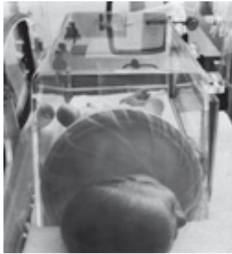
Obr. 1.2 Pulmarka

Vznikaly první jednotky intenzivní péče, které byly založeny na entuziazmu lékařů a sester zabývajících se touto péčí a uvědomujících si rozdíly mezi dosahovanými výsledky u nás a ve vyspělých zemích. Vedoucí lékaři organizovali, léčili, vychovávali sestry a sháněli peníze na přístrojové vybavení. Ze strany porodníků stále ještě přetrvávala nedůvěra v péči a dobrou prognózu novorozenců velmi nízké porodní hmotnosti (pod 1500 g), proto pediatrii přijímali tyto novorozence ve velmi těžkém stavu, a tím se uzavíral začarovaný kruh pro zlepšování jejich prognózy (Plavka, 1995).