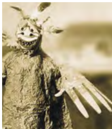
Dřevěná polychromovaná maska aljašského šamana

Přestože mají šamani v mnoha kulturách zcela výjimečné postavení a autoritu, mohou upadnout v nemilost komunity. Důvodem může být neúspěch v léčení, případně nesplnění věštby, díky tomu mohou být v některých kulturách exkomunikováni, potrestáni nebo zabití. Jako případ ze současnosti lze uvést tragické události spojené se zemětřesením na Haiti (2010) a následnou epidemií cholery, která se projevila u desítek tisíc lidí, kteří se nakazili kontaminovanou vodou. Nemoc vyvolala paniku a nenávist vůči šamanům, která pramenila z přesvědčení, že čarodějové a vyznačů kultu voodoo rozšířili cholera očarovaným prachem. Voodoo je na Haiti oficiálním náboženstvím s nejvyšším šamanem, hierarchií mnoha božstev a ustálenými rituály. Víra v sílu černé magie vyvolala paniku a lynčování. Kameny a mačetami bylo zabito, a poté upáleno několik desítek šamanů a čarodějů. Představitelé vlády se snažili trpělivě vysvětlit, že nemoc způsobuje pouze nedostatečná hygiena a nikoli kouzla.