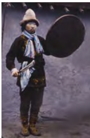
Sibiřští šamani s bubny zajišťovali komunikaci s duchy, 1895

Šamanův obřadní oděv, případně i jeho další součásti (např. maska, vak s magickými předměty) vyjadřují ikonografické a duchovní znaky dané kultury. Tyto znaky se projevují v symbolicko-zástupných významech oděvu, tj. na výběru použitého materiálu, barevnosti, ornamentice, totemových motivech aj. Šamanovo oblečení mnohdy obsahuje i skryté významy nábožensko-magické povahy, které mohou být zřejmé pouze příslušníkům dané komunity. Například šamanův oděv se zobrazením transpersonálních zážitků měl pro příslušníky sibiřského kmene Goldiů magický význam, neboť jej považovali za zosobnění duchů. Vzhled šamanského kostýmu však nemusí být výpravný, může mít pouze symbolickou podobu – například zakrytí hlavy látkou.