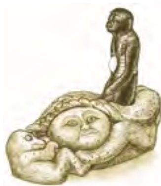
Inuitská mytická bohyně moře Nuliayuk – Sedna