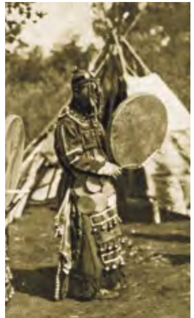
Maskovaný šaman v obřadním oděvu s bubnem