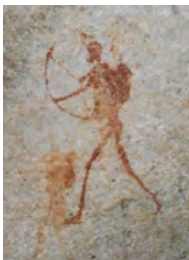
Lovec s lukem je vyobrazen pod skalním převisem v pohoří Cederberg, Sanové, Jihoafrická republika