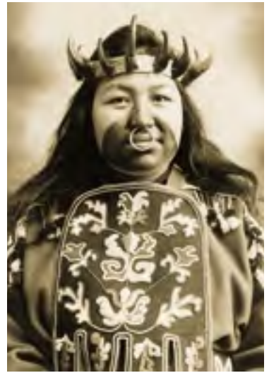
Tlingitská žena s malbou tváře ve slavnostním potlačovém oděvu, 1909

Vzhled šamanských masek podléhal dobově místním zvyklostem, typu obřadu (iniciační, pohřební, léčebný) a tradiční ikonografií zobrazovaného zvířete (medvěda, jaguára, losa). Oděvy z kůže a kožešin, doplňujících masky, bývaly v některých kulturních oblastech zdobeny malbou (Sibiř) nebo atributem totemového zvířete – zuby, zobákem, paroží, peřím, drápy, mušlemi, korálky atp. Na masky a oděvy byl většinou používán materiál přírodního původu – dřevo, keramická hlína, kůže, kožešiny, kosti, šlachy, kožené řemínky, kámen, listy, rostlinná vlákna, kůra a její zpracované části (např. tapa), semena rostlin, mušle a peří. U mnoha etnik se setkáme s různými typy obličejových a nástavcových masek upevněných na hlavě, těle, pokrývkách hlavy nebo konstrukcích. Konečný vzhled masek dotvářela malba, případně reliéfní vrstva hlíny s rytým ornamentem. Podle místních přírodních podmínek byl používán jíl, vápenec, přírodní pigmenty, výtažky a výluhy z rostlin, popel ze spálených mušlí atp. Motiv masek se objevoval také u magických rekvizit, amuletů, šperků, případně na obličejové nebo tělové malbě, která patří ke specifické formě maskování.