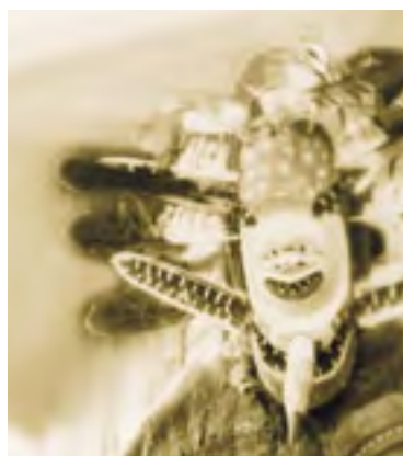
Eskymácký (inuitský) maskovaný šaman, Aljaška