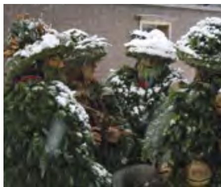
Ve švýcarském městečku Urnäsch se každoročně pořádají prosperitní maskované občůzky