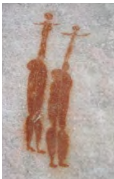
Skalní malby Křováků (Sanů) pocházejí z Jižní Afriky z pohoří Cederberg, nejstarší motivy mohou být i 10 000 let staré