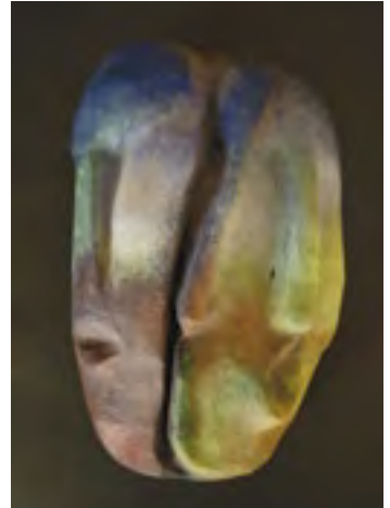
Alter ego, práce autorky, kaširovaná maska, tempera, vosková patina, rozměry 30 × 18 cm, 2002

Knih Maska v proměnách času a kultur je rozdělena do tří celků, první se věnuje charakterizaci masek, vztahům mezi maskou, jejím nositelem a divákem a zabývá se také různými funkcemi a použitím masek. Druhá část je věnována maskám z pěti kontinentů, v jednotlivých kapitolách jsou stručně charakterizované masky z různých kulturních regionů. Je zapotřebí si uvědomit, že přestože se v současnosti s maskami setkáváme spíše v muzeích a galeriích, tvořily a mnohde dosud tvoří součást živé kultury. Třetí část je věnována materiálům a výrobním postupům při tvorbě masky. Rozsah knihy neumožnil zpracovat všechna témata, která se tohoto fascinujícího multikulturního fenoménu týkají. Pokud kniha vyvolá u čtenářů hlubší zájem o masky, přírodně je bude inspirovat k výtvarné tvorbě, aktivní účasti na masopustu nebo jiné maskované události, budu mít pocit, že moje práce splnila zamýšlený účel.