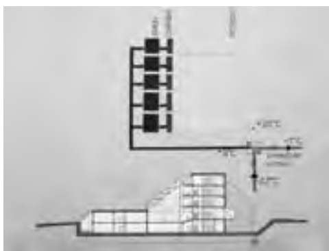
Obr. 2 Schéma proudění řízené výměny vzduchu s rekuperací v zimním období, která nasávala vzduch přes zemní val (administrativní budova OV KSČ, Kolín)