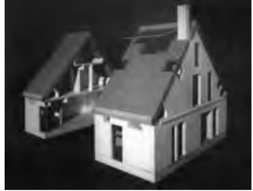
Obr. 4 Model kombinovaného systému domu ze sekci zděných stítů doplňovaných prefabrikáty stropů a střešních panelů na bázi dřevostavby