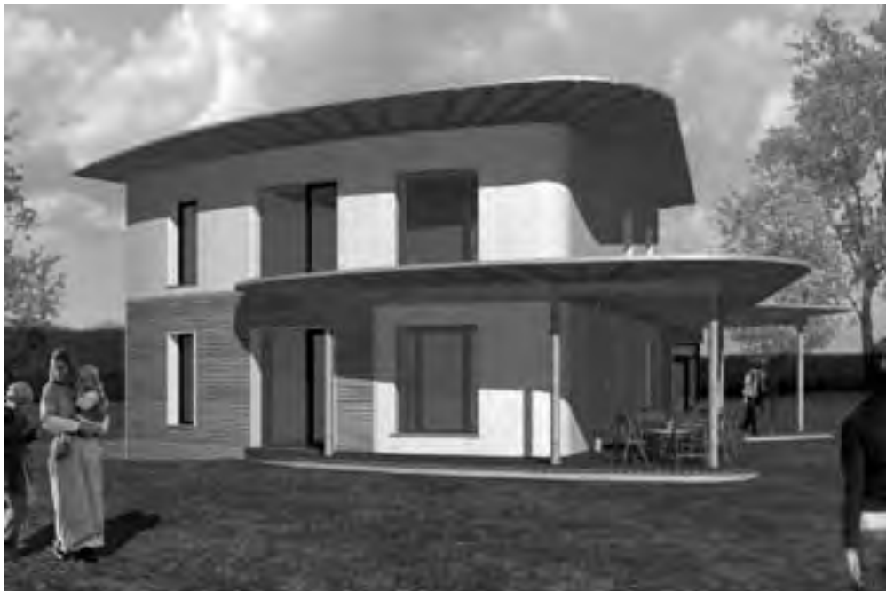
Obr. 12 Návrh prvního pasivního domu z nosné slámy, ve kterém by si každý zájemce mohl vyzkoušet pobyt

Protože historicky průlomová zkouška proběhla 30. 6. 2011 již podle sjednocené evropské legislativy, bude možné její výsledky využívat ve všech zemích EU.