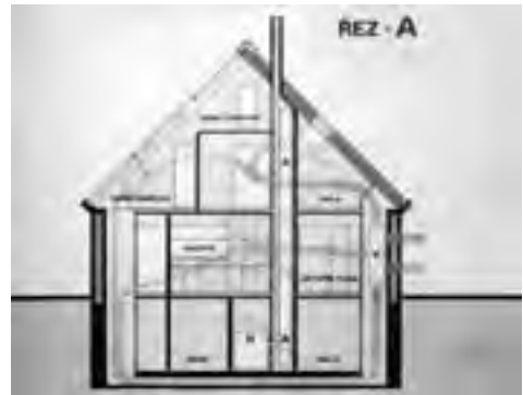
Obr. 5 Řez centrální, základní částí domu, kde byla zimní zahrada a podsklepení s technologickým vybavením kotle na bioplyn a akumulaci nádrží na TUV se stratifikací