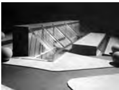
Obr. 1 První pokus o použití principů nízkoenergetického stavění u administrativní budovy OV KSČ v Kolíně

Vrátím-li se zpět do začátku osmdesátých let, přestup do studijního ateliéru, kam jsem původně nechtěl, mi otevřel možnost zabývat se stavěním šetrným k životnímu prostředí v širokém kontextu. Podstatný byl onen duch vedení, kdy nestačí jen nahodile objevit překvapivé řešení, ale jeho opodstatněná volba. Dokumentuje to častá otázka architekta Vrátníka: „Kolego, používáte přiměřené prostředky pro řešení úkol?“ Přemýšlení v dialogu zde totiž