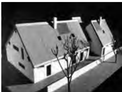
Obr. 8 Severovýchodní nadhled na variantu řadového dvojdomku s garáží