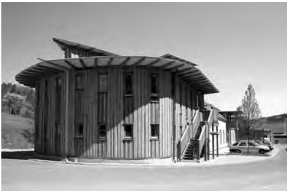
Obr. 11 Multifunkční budova „Archa“, přistavěná k původnímu kravínu revitalizovanému do areálu velkoobchodu, administrativy, školy, pekárny, výroby, mlýna a velkoskladů v Nenačovicích

Ize postavit i 3,6 metru vysokou nosnou stěnu, která byla neuvěřitelně pevná a navíc výborně pohlcovala hluk (taková ideální stavba pro bubeníka). Překvapivé bylo, že jednoduchá vestavba sálu (14 × 5 m) do barokní stodoly vznikla v hrubé stavbě za jeden víkend. Bohužel, bylo zřejmé, že v našich legislativních podmínkách nebylo možné použít slámu jako nosnou, protože chyběly jakékoli normové podklady. Domů navržených s konstrukcí vyplněnou slámou jen náš ateliér navrhl již devět a společně s domy dalších autorů jsou jich už desítky. Záhy se ukázalo, že nejobtížnější je vhodnou slámu zajistit a uskladnit. Je to složitý logistický úkol, vlivem počasí během některých let neproveditelný. Z těchto důvodů nakonec ani stavba pro Country Life není vyplněna slámou.