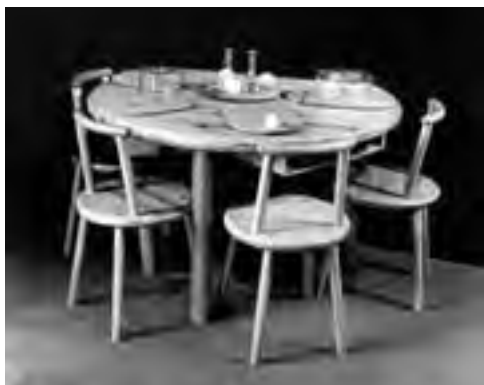
Obr. 9 Jídelní set (snadno opravitelný) z masivního lepeného dřeva založený na detailu vyzkoušeného historii – rozklenovaný čep s vysokou pevností

ka, kterou lze postupně zvětšovat podle potřeb a dispozičně přizpůsobovat generačním změnám. Dům by situačně vyhověl i čtyřem singlům nebo jedné rodině s malými dětmi (obr. 4). Samozřejmě šlo i o dům nízkoenergetický, se vším, co k tomu patří, a zásobovaný mixem energií z místních zdrojů (tím již odpovídal duchu směrnice EPBD II, která míří k domům téměř nulovým, obr. 7, 8). Diplomka si ale dala za cíl neskončit jen u urbanismu a rodinného domu, ale dopracovat se až k detailu, do tzv. ekodesignu 2 nábytku. Ten řešil vše od univerzálního kuchyňského prkénka přes zařízení interiérů až po celý jídelní soubor, s doplňky od kolegů z oborů keramiky a skla. Instinkt nás vedl k tomu, že změna systému je spojena i s potřebou změnit životní postoj. Obracet se od konzumního paradigmatu a vytvářet předměty dlouhodobé spotřeby, které se rychle nemění v odpad nahrazený odpadem novým. Paradoxně to bylo v době, kdy jsme konzumní systém znali jen z doslechu zpoza železné opony.