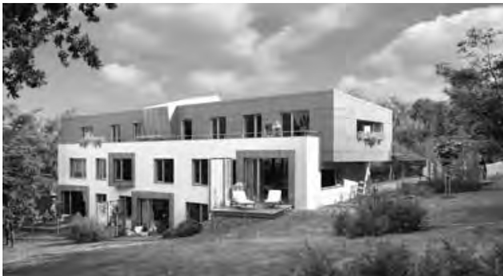
Obr. 15 První pasivní bytové viladům v ČR – Pod Altánem, Praha; návrh (vizualizace)