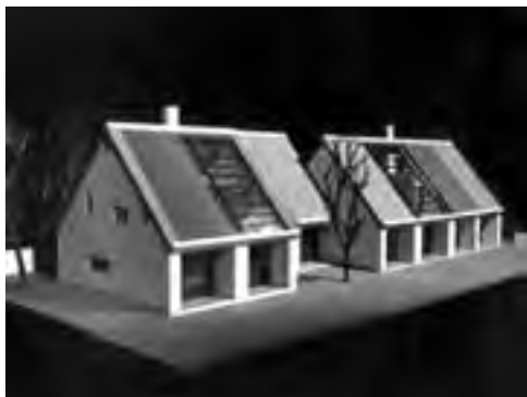
Obr. 7 Jihozápadní pohled na variantu řadového dvojdomku s garáží