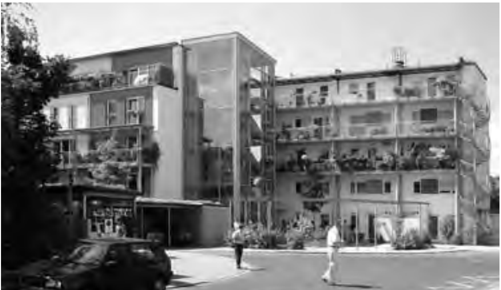
Obr. 14 Pasivní bytový dům Gremppstraße, Frankfurt nad Mohanem. Architekti: faktor 10 GmbH

Již řadu let existují poměrně primitivní technologické postupy, kterými si lze s energetickou náročností poradit a zároveň přejít na vysoký standard bydlení nejen kvantitativně, ale i kvalitativně. Bohužel, zatím se o této šanci vědělo pouze velmi málo a chopila se jí jen nepočtená skupina investorů-nadšenců stavějících rodinné domy. Jedním z důvodů byly doposud nízké ceny energie, které navíc ve své ceně nezahrnují cenu všech nákladů na její výrobu a všech externalit, škod na lidském zdraví i životním prostředí. Cena energie dnes ná-