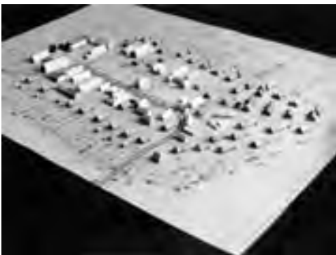
Obr. 3 Model urbanismu doplňování původní vesnice postupným dorůstáním a zahušťováním v duchu původní vesnice založené v období gotiky