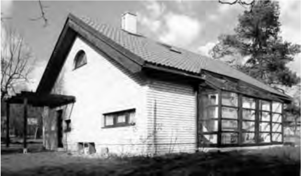
Obr. 10 RD u Mníšku pod Brdy s první reálnou zkušeností s šikmou nestíněnou prosklenou plochou zimní zahrady, zateplený izolací Climatizer Plus v tloušťce 120 mm

ticky šetrný (tzn. lépe izolovaný) RD si podle mého konceptu postavil kamarád pro své rodiče na důchod, a to až těsně po revoluci (obr. 10). Ale ani takoveto energeticky minimalistické domy ještě dlouho nikoho nezajímaly. Já jsem do doby, než jsem pracoval pro klienty z prvního nízkoenergetického domu, mohl jen šířit osvětu, aby jich mohlo přibývat. Dále jsem spolupracoval s Bohuslavem Blažkem, třeba i na územním plánu sídelního útvaru Libčevěves. Během toho jsem se stal i lektorem první ze Škol obnovy venkova , která tu vznikla jako klíčová rozvojová aktivita obce. I zde jsem mohl začít s předáváním informací o možnostech energetických úspor v provozu i ve výstavbě budov.