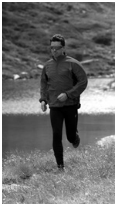
Běh jako vynikající pohybový prostředek a lék na naši psychiku

Podtrženo a sečteno: V dnešní na pohyb chudé době se stal kondiční běh ideálním kompenzačním prostředkem. Běhat lze téměř kdekoliv a kdykoliv. Běh není např. ve srovnání s cyklistikou ani příliš časově náročný. Pro dosažení stejného cíle stačí běhat výrazně kratší dobu. Je potěšitelné, že běhu u nás přichází na chuť stále více a více lidí.