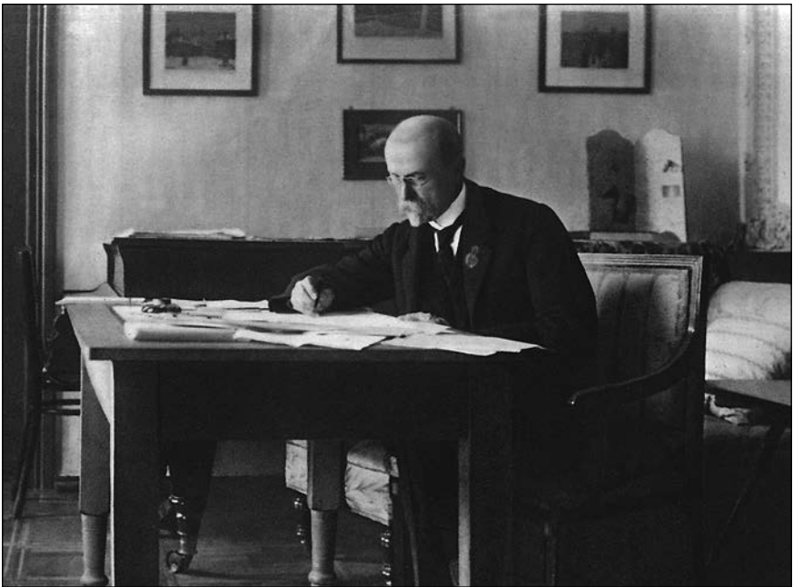
Profesor Masaryk na podzim 1917

prostoru jako by neskončila. A pokud podle vyjádření dohodových států skončila, rozhořela se na moravsko-slovenské hranici válka nová, nikým a nikomu nevyhlášená. Zdálo se, že různé národnostní skupiny, ale především představitelé vídeňského i pešťského parlamentu a jim podobní „organizátoři“, chtěli zneužít rozkladu rakousko-uherského císařství i neinformovanosti místních obyvatel bez ohledu na rozhodnutí vítězných států výhradně ve svůj prospěch.