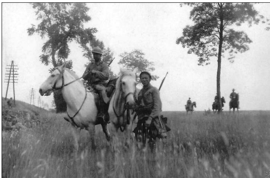
Jízdní hlídka francouzských legionářů na průzkumu

Jako první ovšem překračují slovenskou hranici vojáci náhradního praporu číslo 25 rakousko-uherského střeleckého pluku, vracející se ze St. Pöltenu poblíž Vídně do Kroměříže. Při zastávce v Hodoníně je místní národní výbor žádá, aby přerušili cestu domů a zajeli přes hranici do nedalekého slovenského Holíče a zabránili tam dalšímu rabování.