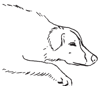
Řeč těla: Uvolnění

Na druhou stranu přivřené oči, skloněná hlava, uši do stran a těžké vzdechy jsou jasnými signály relaxace a potěšení. Neustále sledujte řeč psího těla a svou práci jí přizpůsobujte.