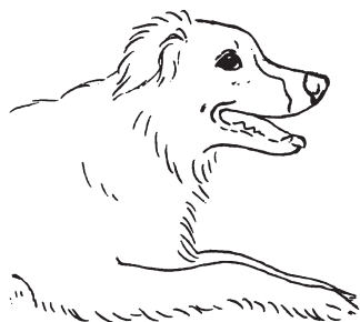
Řeč těla: Napětí