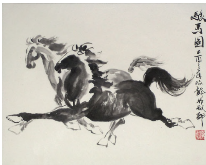
Kůň – symbol úspěchu

Další pověst se týká magického čtverce Lo-šu. Tento dodnes používaný čtverec byl údajně spatřen na zádech černé želvy, jenž se vynořila z vln Žluté řeky. Kapky vody, které ulpěly na jejím krunýři vytvořily čísla magického čtverce a staly se tak základem čínské numerologie.