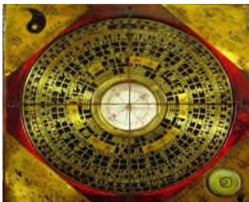
Kompas poradce Feng Shui

Naleznete zde univerzální typy, které lze okamžitě použít. Pokud však chcete svůj byt nebo kancelář zharmonizovat opravdu kvalitně, doporučuji vám vyhledat zkušeného poradce Feng Shui, který provede analýzu vašeho prostoru na místě a při- způsobí své rady vaší osobnosti a členům vaší rodiny nebo týmu. Pravděpodobně také použije kombinaci více metod, pro získání hlubší analýzy.