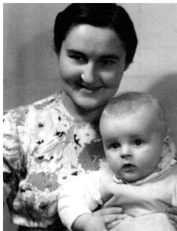
S maminkou (1937)