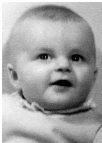
Spokojené mimino (1937)

Starší člověk rád vzpomíná – tedy když na to má čas. Vrací se k tomu, co bylo. A když toho bylo v životě hodně, má dost co dělat. Nedělá to snad jenom kvůli sobě, ale možná chce – jak říká Nietzsche – „zachraňovat minulost“, to jest uvádět na pravou míru to, co se z ní překroutilo, co by se nemělo ztratit. Možná chce dohonit něco, co v té minulosti sám zapomněl, třeba se někomu omluvit nebo poděkovat. Jenže kde tu minulost vzít? Paměť není žádný záznam toho, co se stalo, ale spíš jakýsi pytlík s příhodami a obrázky, které člověka tak nadchly nebo zranily, že mu tam uvízly. Vzpomínky tam ovšem nejsou nasypané vedle sebe, ale žijí vlastním životem, všelijak se mezi sebou ovlivňují a spojují, konfrontují se s tím, co se člověk dozvěděl od