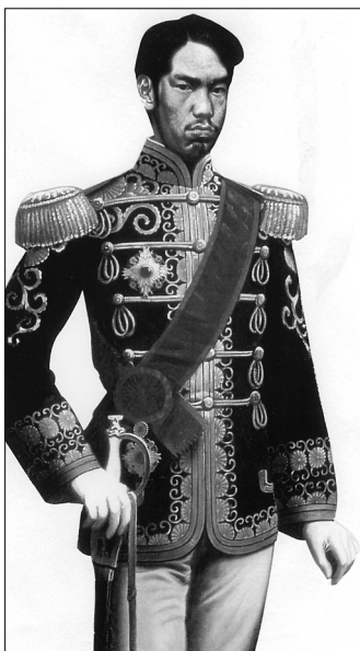
Japonský císař Mucuhito

V 70. letech devatenáctého století se o slovo v boji o Čínu začalo dravě hlásit Japonsko. Jelikož se v jižních oblastech čínského území nemohly jeho zájmy kvůli francouzské a britské přítomnosti nijak uplatnit, bylo