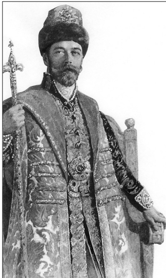
Ruský car Mikuláš II.

Velkou snahu o získání vlivu v této části světa ovšem vyvíjely i další mocnosti. Platí to zejména o Rusku. Tato země pokračovala v tradici expanzivního úsilí cara Petra Velikého, jenž se snažil učinit ze svého převážně asijského státu evropskou říši a jak známo z dějin, sám v tomto směru pracoval s největší energií uvnitř i navenek. Jeho hlavním přáním, které