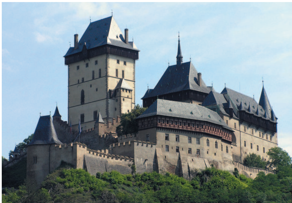
Obrázek 1.3 Hrad Karlštejn – národní kulturní památka