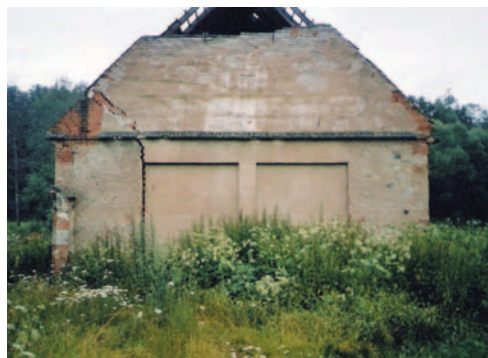
Obrázek 2.10 Trhlina ve zdivu vzniklá v důsledku podmáčení základů vodou z povodňové vlny