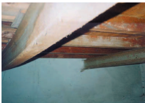
Obrázek 2.1 Nadměrný průhyb stropního trámu

Poruchy stavebních konstrukcí mohou být zapříčiněny: