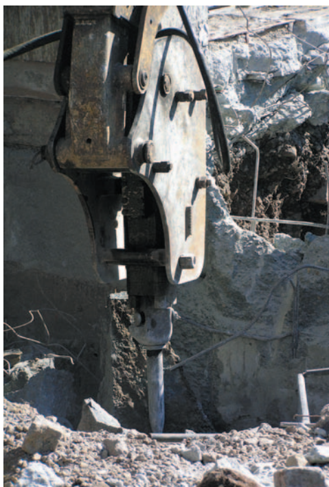
Obrázek 3.2 Bourání pneumatickým kladivem

Provádí se obvykle buldozerem, nebo těžkým vozidlem. V případě použití těžkého vozidla se příslušná konstrukce (krov, zdivo, strop) připojí k vozidlu pomocí lan. Pojezdem vozidla pak dojde ke stržení konstrukce.