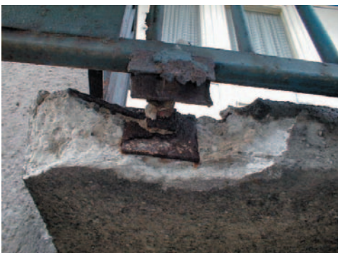
Obrázek 2.8 Zvětrání betonu a jeho odpadávání v důsledku povětrnostních vlivů