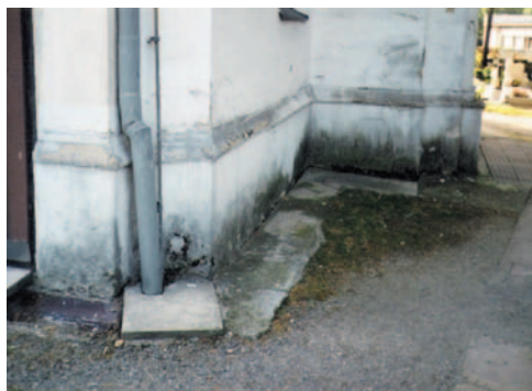
Obrázek 2.5 Nadměrné zavlhčení soklu následkem odšťikující vody a použití nevhodného fasádního nátěru v místě soklu. Chybné napojení dešťového odpadu