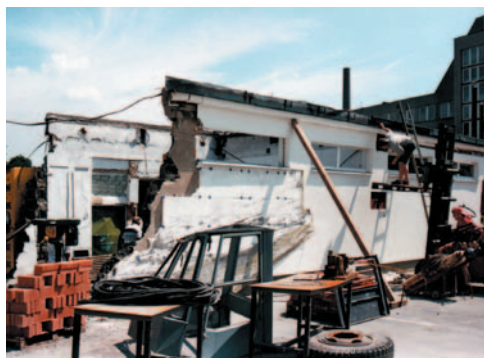
Obrázek 2.13 Destrukce objektu následkem výbuchu plynu