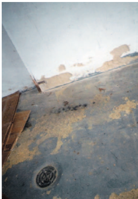
Obrázek 2.11 Destrukce omítky a nášlapné vrstvy podlahy v suterénu následkem zaplavení vodou uniklou z kanalizace