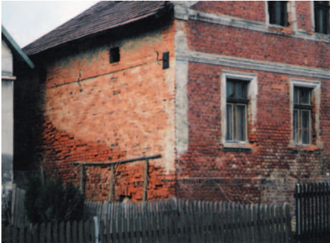
Obrázek 2.7 Zvětrání cihelného zdiva následkem povětrnostních vlivů