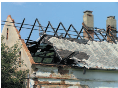
Obrázek 2.14 Destrukce objektu následkem požáru