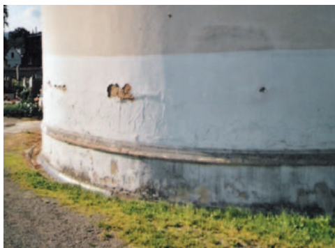
Obrázek 2.6 Odpadávání omítky v důsledku aplikace nevhodného fasádního nátěru (akrylátový nátěr s vysokým difúzním odporem, který uzavřel v omítce nadměrné množství vody)