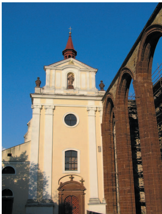
Obrázek 1.2 Areál Sázavského kláštera – národní kulturní památka