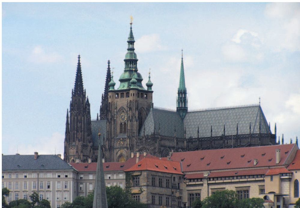
Obrázek 1.1 Pražský Hrad – národní kulturní památka