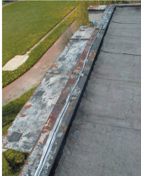
Obrázek 2.9 Korozí oplochosování atiky zapříčiněná povětrnostními vlivy