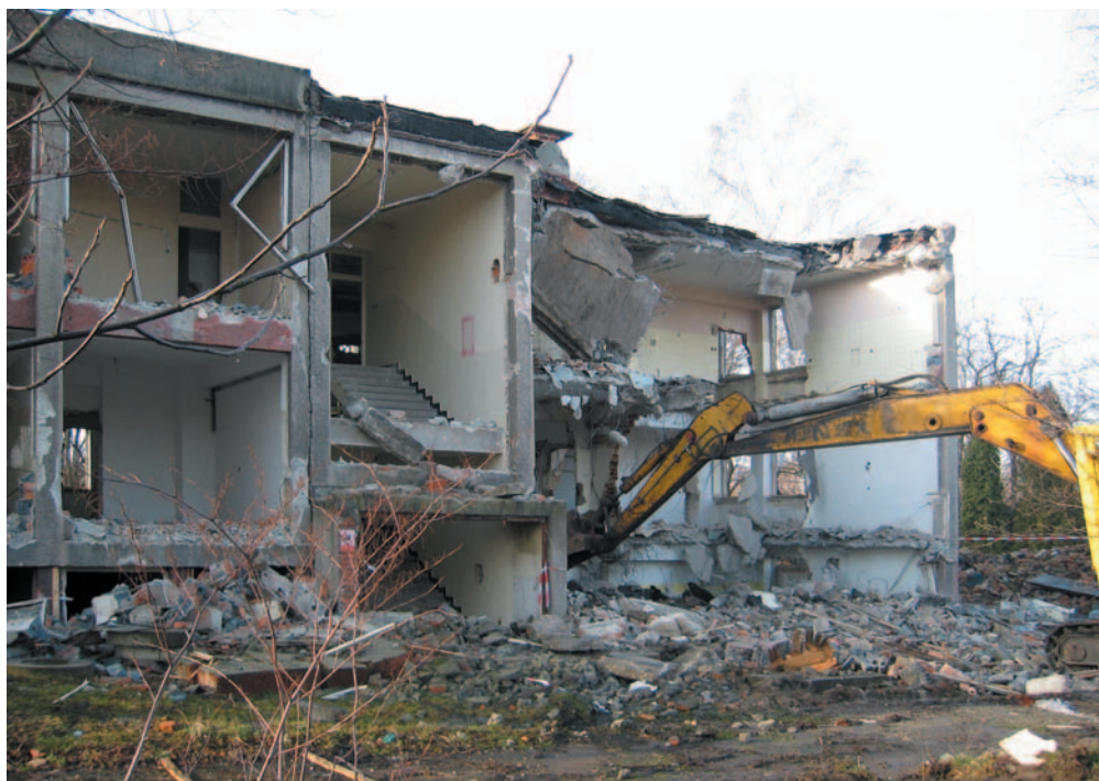
Obrázek 3.1 Ukázka demolice celého objektu s použitím těžké mechanizace