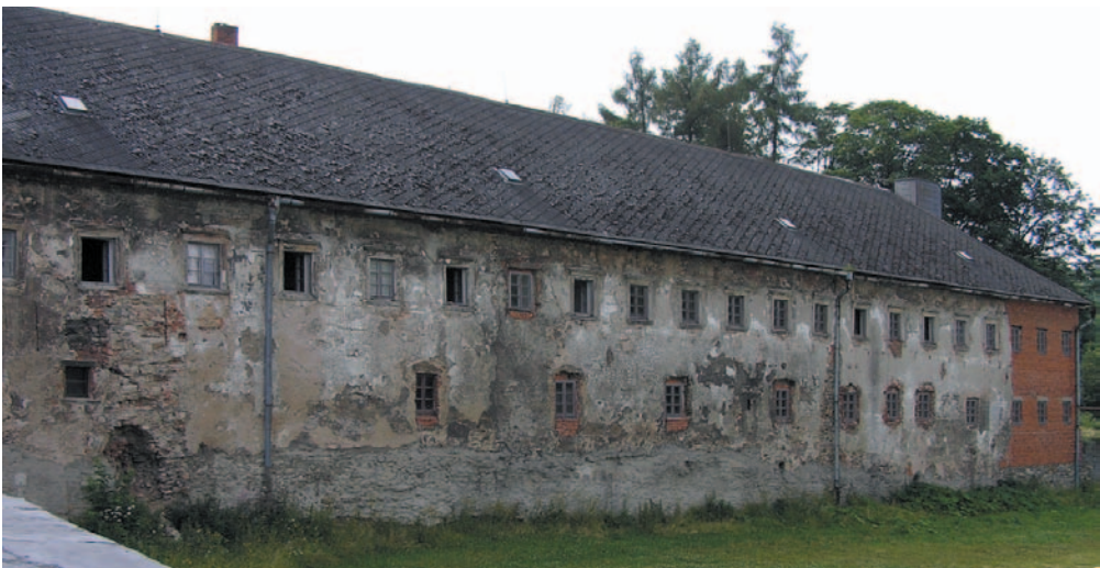
Obrázek 2.15 až 2.18 Příklady poruch způsobených opotřebením materiálu a stárnutím, resp. zanedbanou údržbou