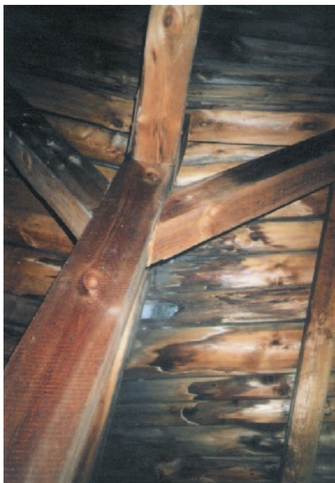
Obrázek 2.12 Napadení dřevěného bednění střechy hnilobou v důsledku zatékání dešťové vody