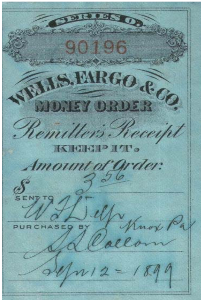
Western Union – poštovní peněžní poukázka a poukázka pro telegrafické zaslání peněz

A v čem spočívala jejich výhoda? Klient zakoupí cestovní šek v určité hodnotě (např. 100 USD, 50 GBP apod.) a podepíše se na něj. Současně obdrží doklad o nákupu s telefonním spojením na klientská centra pro případ, že by došlo ke ztrátě nebo krádeži cestovního šeku. Při placení v hotelu nebo obchodě, které cestovní šeky přijímají, nebo při výběru hotovosti ve směnárnách, předloží klient cestovní šek a ještě jednou ho podepíše. Oba podpisy musí být shodné. Klient navíc předkládá i svůj průkaz totožnosti. Šek tak může použít jen jeho skutečný majitel, na rozdíl od peněz, jež jsou anonymní a může je použít náhodný nálezce, stejně jako kapsář. V případě ztráty nebo krádeže šeku dostává klient do dvou dnů nový šek.