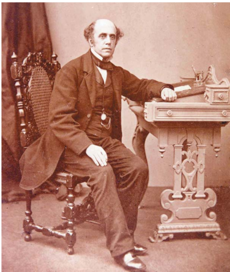
Vynálezce cestovního šeku a zakladatel cestovní kanceláře Thomas Cook

bezhotovostního placení na cestách a v obchodech, podívat podrobněji.