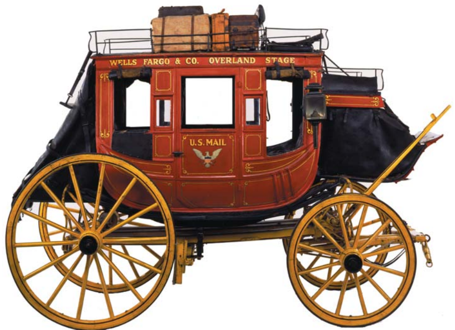
Známý dostavník Concord vozil na trasách Wells Fargo & Co. cestující, poštu i peníze

Od samého počátku oznamovaly nápisy na první pobočce Wells Fargo v San Francisku, že firma poskytuje kurýrní a bankovní služby – „Express Office and Banking House“. První reklama z roku 1852 popisovala bankovní služby společnosti takto: nákup a doprava zlata, výplata šeků, prodej bankovních směnec k proplacení v jiných státech a v zámoří, příjem vkladů a úschov. Společnost Wells Fargo